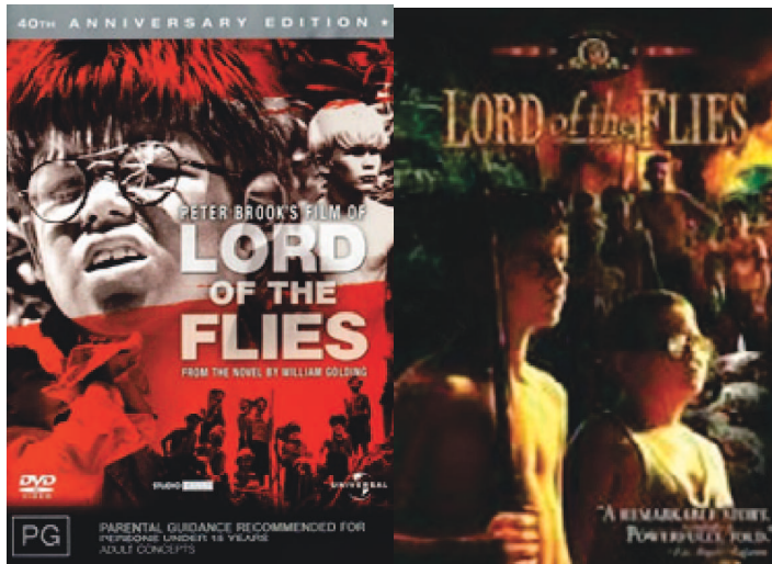
Figura 2. Cartazes do filme de Peter Brook e Harry Hook.

A separate peace foi realizado em 1972 por Larry Peerce e depois ainda teve uma versão para televisão em 2004 por Peter Yates.