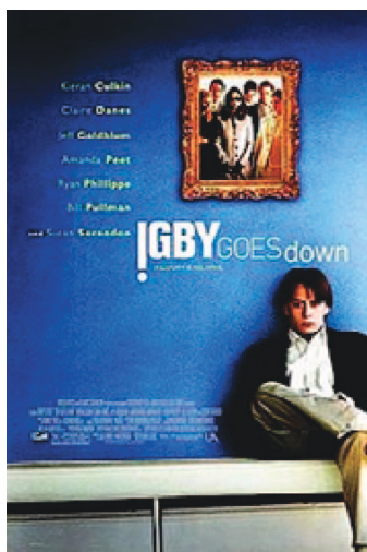
Figura 1. Cartaz do filme de Burr Steers

No entanto, muitos realizadores durante a vida do autor se mostraram interessados em realizar o filme, entre os quais Billy Wilder, Elia Kazan e Steven Spielberg, tendo havido ao longo dos tempos outros tantos autores famosos interessados no papel do protagonista tais como Jerry Lewis, Marlon Brando, Jack Nicholson e Leonardo di Caprio.