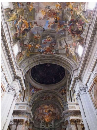
Figura 4: "Falsa cúpula – Igreja St. Inácio", Andrea Pozzo

O teto construído sobre uma superfície curva é observado, segundo indicação do próprio Pozzo, a partir de um disco de mármore no centro da nave que marca o ponto ideal a partir do qual o observador pode apreciar de forma plena a ilusão. Este é único porque, ao tratar-se de uma projeção geométrica, de qualquer outro ponto, os pilares e arcos pintados parecem torcidos e suspensos (Blakemore, 1986). A intenção de Pozzo foi, através de uma ilusão de ótica, abrir a superfície da abóbada de berço servindo-se de técnicas de projeção que faz com que um observador no chão veja uma enorme e luxuosa cúpula aberta para o céu brilhante e repleta de figuras flutuando para o alto.