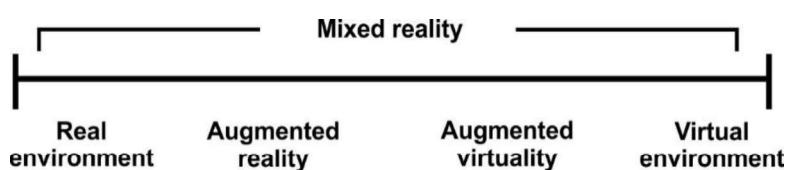
Figura 1: "virtuality continuum"

Paul Milgram & Fumino Kishino (1994) desenvolveram uma taxonomia baseada na Realidade Mista ("Mixed Reality") que designaram de "virtuality continuum" que envolve a fusão e complementaridade de ambiente real e do ambiente virtual (cf. figura 1).