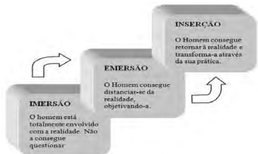
Figura 1 - Relação do Homem com o Mundo

inserção que implica que o homem consiga retornar à realidade, conseguindo-a transformar através da sua prática.