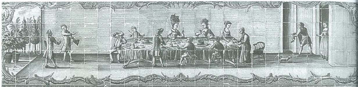
Apologia do garfo, coleção particular, segunda metade do século XVIII.

preponderantes e eminentemente sociais, tornando-se um simulacro de vida social. Pelas suas qualidades «artificiosas», o azulejo propõe espectáculos (no sentido em que se exterioriza tudo o que se pretende mostrar, para emocionar) através da exaltação sensorial, definindo-se como espaço de representação social , em varandas, pátios, terraços, fontes, bancos e alegretes, cozinhas, corredores e salões nobres.