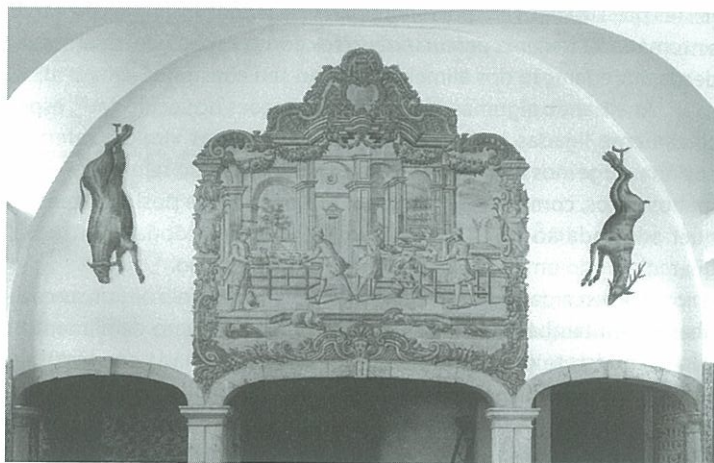
Palácio do Correio-mor, Loures. Paineis de azulejos colocados sobre a chaminé da cozinha: A preparação de uma refeição . Oficina de Lisboa, meados do século XVIII.

sional, ou seja, a representação de uma cozinha dentro da cozinha, uma colagem especular, concepção segundo a qual a pintura cerâmica reflete, de forma sucinta, objectos, alimentos e personagens.