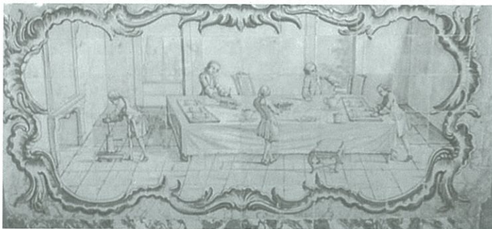
Palácio Pombal, Oeiras. Preparação do chocolate . Paineis de azulejos do segundo quartel do século xviii.

O forte poder da imagem, o sentido visual alargado e reconhecido na sociedade deste período encontraram neste suporte artístico um instrumento adequado na medida em este proporcionava e facilitava a apropriação de um discurso visual por parte de destinatários específicos. A azulejaria assumirá durante este período um papel e uma função