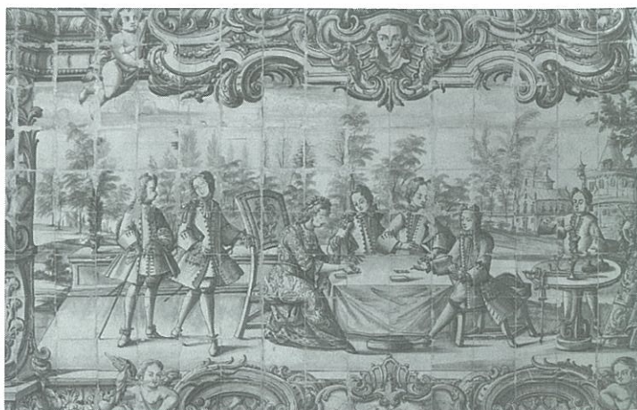
Quinta das Carrafouchas, Loures. Pormenor de painel de azulejos no interior do nicho central do lago, Cena de refeição ao ar livre , oficina de Lisboa, primeira metade do século XVIII.

e a terrina trazidos pelo criado, a toalha dobrada que cobre a mesa. O painel tem como enquadramento – quer das figuras, quer de todo o conjunto – uma cartela pintada a azul mais forte, que funciona quase como uma boca de cena, característica tão comum aos painéis desta fase.