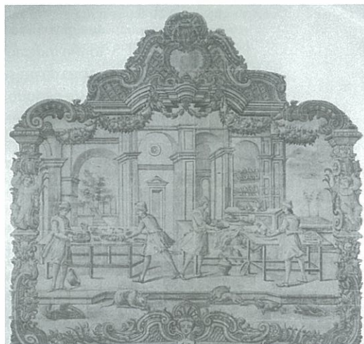
Pormenor do painel de azulejos A preparação de uma refeição , colocado em cima da chaminé. Oficina de Lisboa, meados do século XVIII.

Não temos dúvidas em afirmar que esta relação entre as cenas e o espaço em que elas se inserem poderá combinar-se numa relação vincadamente dialéctica com um princípio narrativo, expositivo, ilustrativo e também didáctico. A análise das funções sociais destas pinturas cerâmicas dá formato aos eixos fundamentais de uma concepção da sociedade da época. Sob este ponto de vista, os espaços da casa podem ser considerados um referente espacial que organiza uma visão da sociedade, constituindo um ponto de ligação com o universo da sua própria representação.