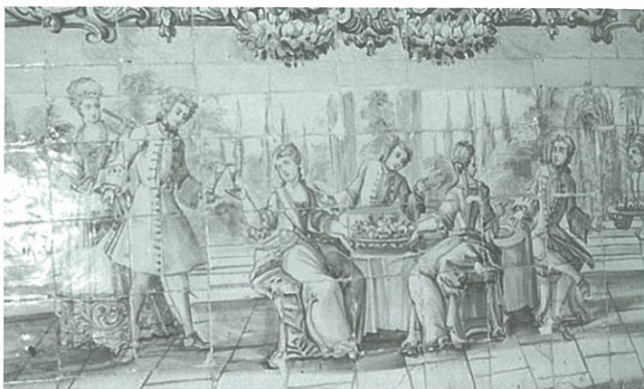
Palácio Valada, Azambuja, Lisboa. Pormenor de painel de azulejos da segunda metade do século XVIII.

– o painel de azulejos situado numa das paredes exteriores do Palácio dos Guiões, na Rua Filipe Nery em Lisboa 20 , representando uma cena de refeição em espaço fechado. Destaque para a preocupação que o pintor de azulejos teve em traçar determinados pormenores, como a iguaria colocada no centro da mesa, provavelmente um coelho, o refrescador 21 contendo várias garrafas de bebidas, os copos, o jarro