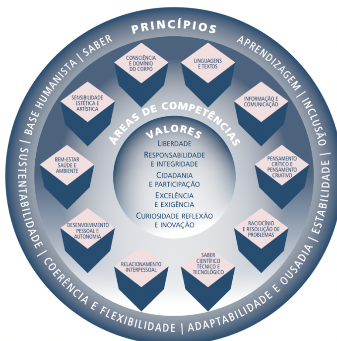
Figura 6. Esquema conceptual do “Perfil dos Alunos à Saída da Escolaridade Obrigatória” (Estabelecimentos Nos Ensinos Pré-escolar, Básico E Secundário Público: Total E Por Nível De Ensino, 2020).

O “Perfil dos Alunos à Saída da Escolaridade Obrigatória”, desenvolvido pelo Ministério da Educação e Ciência, descreve o conjunto de conhecimentos, capacidades e competências que os alunos devem ter adquirido ao longo do ensino obrigatório. Este perfil inclui princípios, competências e valores, representados graficamente na figura 6: