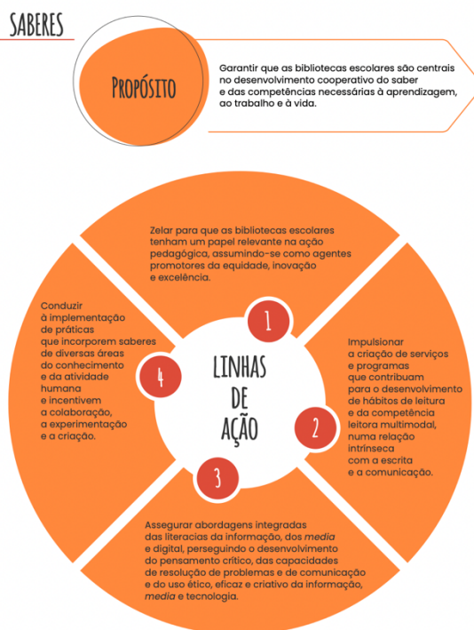
Figura 7. Linha de Ação: Saberes

O objetivo de “garantir que as bibliotecas escolares são centrais no desenvolvimento cooperativo do saber e das competências necessárias à aprendizagem, ao trabalho e à vida” é, quando aliado à posição frágil da biblioteca escolar no processo educativo e à falta de força na escola, difícil. Neste documento, a RBE põe a biblioteca a encabeçar ações como “impulsionar a criação de serviços e programas”, “assegurar abordagens integradas das literacias da informação, dos media e digital” e “conduzir à implementação de práticas que incorporem saberes de diversas áreas do conhecimento”, mas omite uma parte que consideramos importante: como e com que recursos deve ser feita esta implementação.