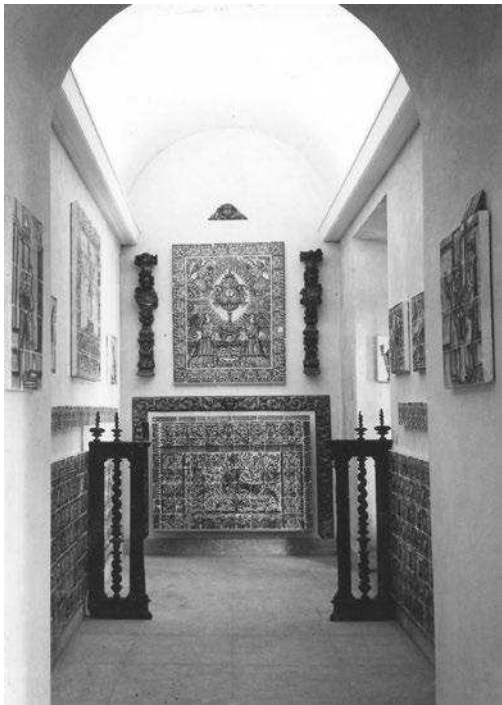
FIG. 3 Museu Nacional do Azulejo (Lisboa, Portugal), Exposição permanente.