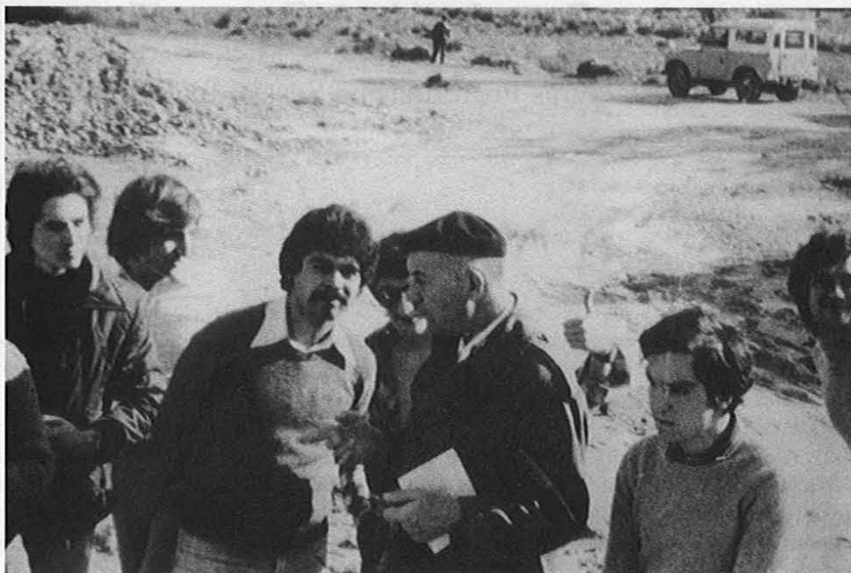
Fig. 1 - 1978. Visita de estudo aos terraços de Alpiarça, no âmbito da disciplina Estratigrafia e Geohistória, do 3º ano da licenciatura em Geologia da Faculdade de Ciências de Lisboa.

aristocracia russa e de um oficial polaco, vitimado na 1ª Guerra Mundial. Obrigado a abandonar o seu País, em plena guerra civil, em clima de revoluções, de morte e de terror, conforme o próprio declarou um dia (Zbyszewski, 1984), aos 8 anos, a família instalou-se em Paris, onde fez o Liceu e a Faculdade, já atraído pela Geologia.