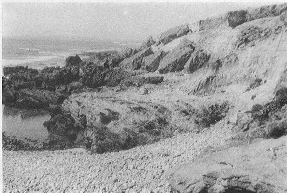
Fig. 4 - 1946. Vista parcial do lado setentrional da praia do Fortim de Porto Covo (Pessegueiro), com blocos de duna consolidada tombados na arriba.