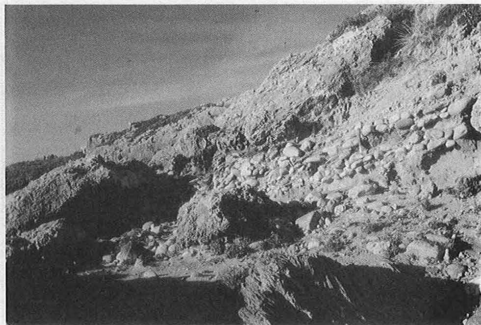
Fig. 5 - 1991. Vista aproximada do mesmo trecho da praia do Fortim de Porto Covo da Fig. 4, na actualidade.