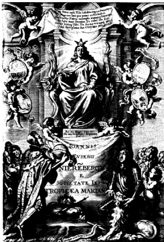
Figura 2 – Filipe IV e D. João de Áustria prestam vassalagem à Virgem Imaculada, Rainha do Céu (c. 1658), gravura de Peter van Lisebetten a partir de um desenho de Philippe Fruytiers (frontispício da obra Trophea Mariana de Juan Eusebio Nieremberg).

Mas o que é mais significativo são os textos bíblicos citados e a súplica introduzida pelo gravurista. Na parte superior da gravura, ele introduz um excerto glosado do livro de Isaías, onde se lê: “Os reis hão de levantar-se ao ver-te, os príncipes se prostrarão, adorando o Senhor teu Deus e o Santo de Israel que te escolheu concebida sem mácula ” (Is 49, 7). 25 Além de introduzir a doutrina imaculista na glosa do texto bíblico, observa-se que o artista quer sublinhar o compromisso dos governantes com o culto e devoção marianos. A súplica na parte inferior da gravura releva claramente o uso político dessa devoção: Dignare nos defendere te, virgo sacrata, da nobis virtutem contra hostes tuas (“Fazei-nos dignos de vos defender, ó Virgem sagrada; dai-nos força contra os vossos inimigos”). Os adversários da Restauração, os espanhóis, são evocados como inimigos da Virgem Imaculada!