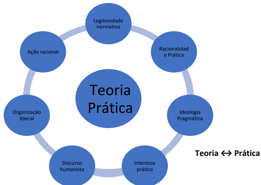
Figura 1.2: Fundamentação da Teoria Prática.