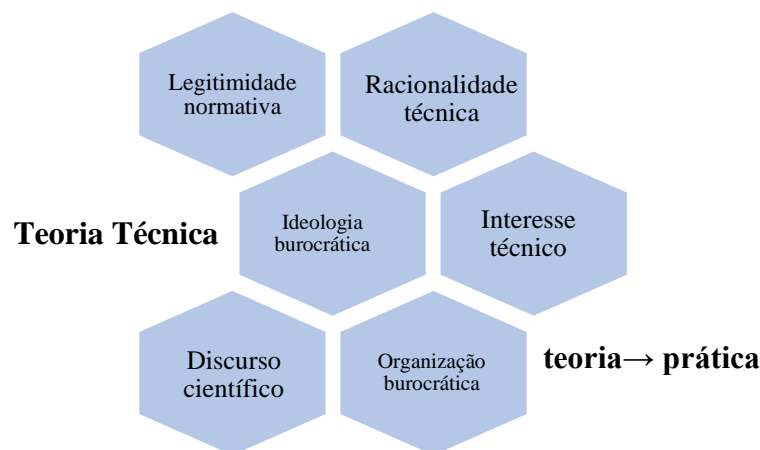
Figura 1.1: Síntese da Teoria Técnica.