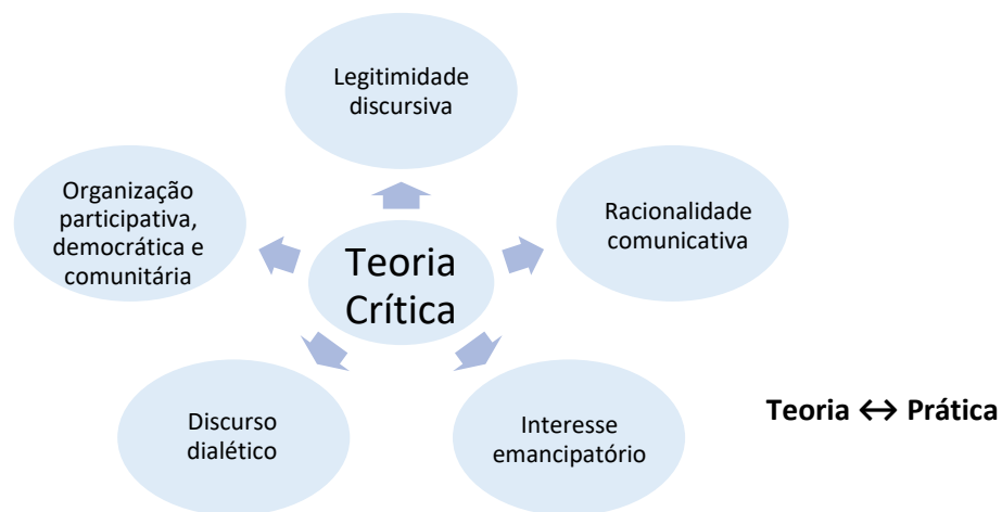
Figura 1.3: Síntese da Teoria Crítica. Segundo Pacheco (2001, p.40).