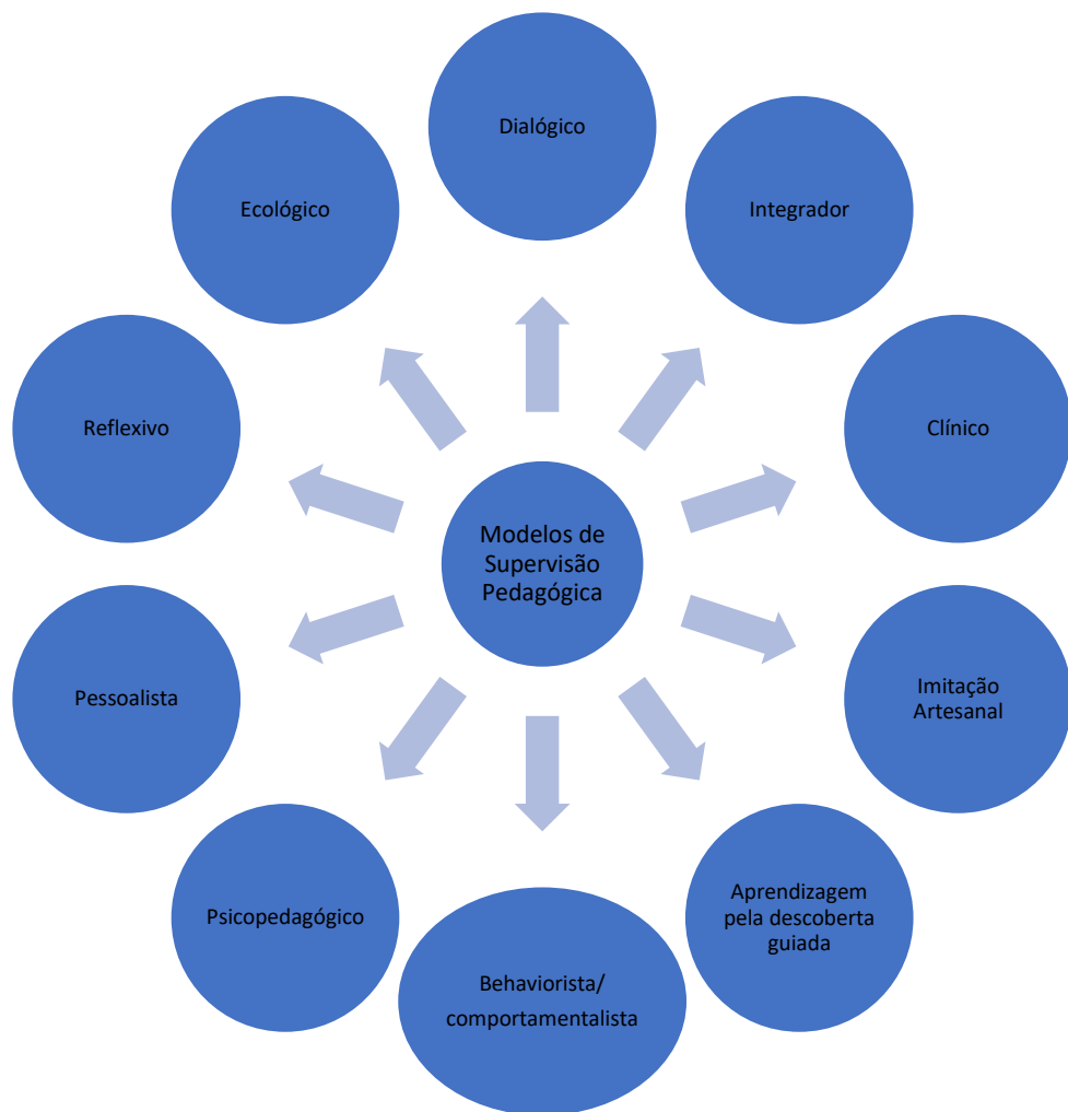
Figura 2.1: Representação dos Modelos de Supervisão Pedagógica.

De acordo com a revisão da literatura, podemos considerar os seguintes modelos de supervisão pedagógica: Modelo Clínico, Modelo de Imitação Artesanal, Modelo de Aprendizagem pela Descoberta Guiada, Modelo Behaviorista/Comportamentalista, Modelo Psicopedagógico, Modelo Pessoalista, Modelo Reflexivo, Modelo Ecológico, Modelo Dialógico e Modelo Integrador, os quais passaremos de seguida a descrever de modo sumário.