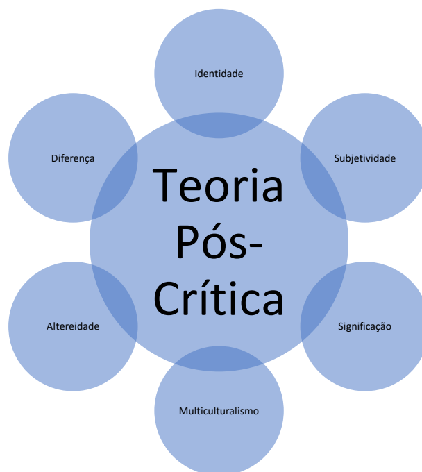
Figura 1.4: Síntese da Teoria Pós-Crítica. Segundo Pacheco (2014).

Tem como finalidade alcançar a fundação de uma educação mais democrática, inclusiva e participativa, que incentiva ao multiculturalismo e pluralidade de perspectivas. Esta teoria é relativamente recente, patenteando-se em constante evolução, sendo motivo de debates e reflexões por parte dos especialistas em educação.