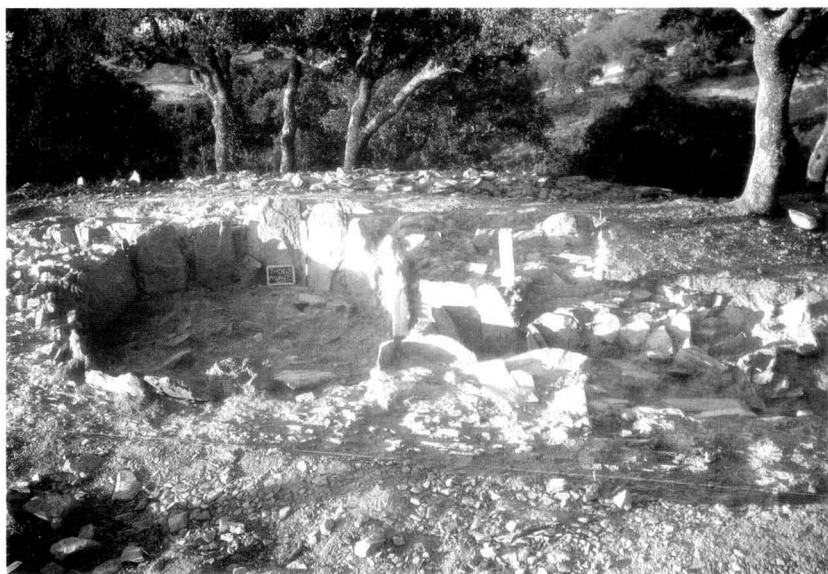
FIG. 1 – Tholos do Cerro do Malhanito. Vista geral do monumento obtida de Oeste. Note-se a abundância de blocos, colmatando de forma caótica o interior da câmara sepulcral.