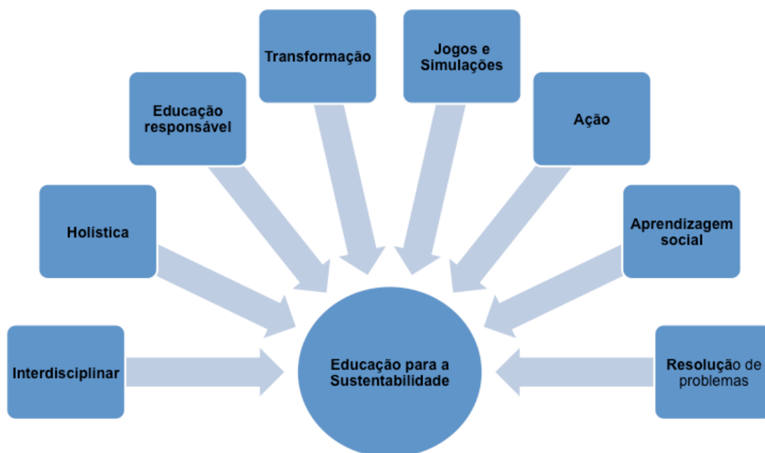
Figura 2- Abordagens de implementação da EDS/ESS.

mostram bastante consenso no apoio aos valores ecológicos" e "têm consciência dos atuais abusos sobre a Natureza e o Ambiente". 2