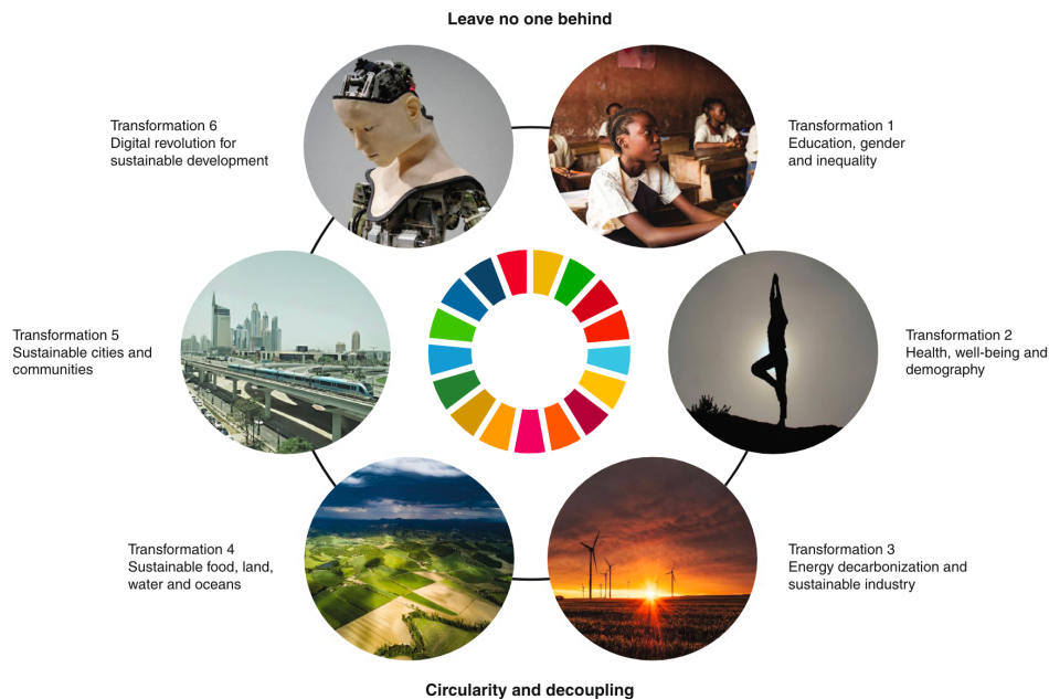
Figura 3 - Seis transformações dos ODS e o papel da Educação como primeira transformação (adaptado de Satche et al. (2019) e TWI2025 (2018))

Neste âmbito, a primeira transformação inclui três conjuntos de intervenções para promover a educação e a igualdade de género e para reduzir as desigualdades. Mas de que modo? Sach et al (2019), explicaram as medidas de realização da transformação para a Educação no âmbito dos ODS: