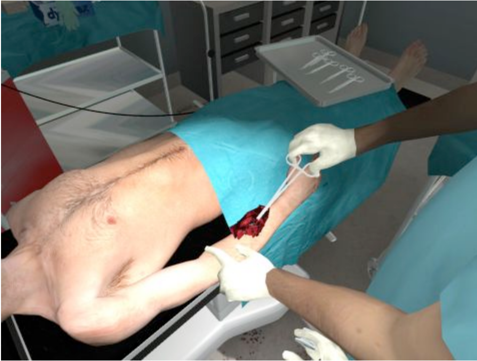
Figura 3: Uma simulação médica para o jogo Half Life 2 (CMP Media, 2005)

Uma observação digna de nota refere que a melhor experiência de aprendizagem é desfrutada pelos autores de conteúdos multimédia e não pelos próprios estudantes a quem se destina o material (Kommers et al, 1992). Isto é interessante se pensarmos que, segundo a perspectiva construtivista do processo de aprendizagem, o objectivo fundamental é dar ao estudante a oportunidade de desempenhar tarefas que conduzem a uma melhor compreensão das matérias, nomeadamente, serem eles próprios os autores dos conteúdos multimédia, uma das características evidentes nos modelos de AMI. Porém, a interactividade não é, por si só, suficiente. “Interacção” deve significar que o estudante procura respostas para perguntas novas, que organiza o material em estruturas novas ou que executa manipulações que elevam o seu nível de compreensão de uma determinada matéria.