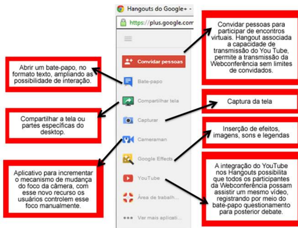
Figura 5 – Aplicativo Hangout e suas ferramentas

A ferramenta Hangout disponibiliza um conjunto de aplicativos (Figura 5) que otimiza o gerenciamento do encontro síncrono: abertura de um espaço de bate-papo textual, o compartilhamento e a captura de tela, a socialização de vídeos postados, entre outros tantos efeitos.