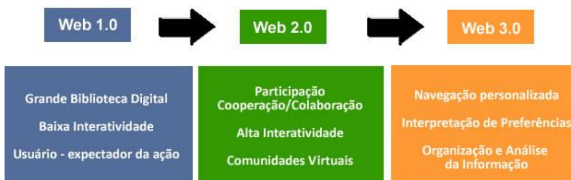
Figura 1. A evolução da Web

O perfil do usuário da Web foi alterado com a conquista de novos instrumentos para gerar conhecimento, criar e interagir em comunidades digitais. Inaugura-se a Era do Usuário, a da Geração Interativa, produzida sob o conceito da inteligência coletiva e explicitada pelas múltiplas possibilidades de partilha e cooperação. Os atuais sistemas web projetam a personalização da navegação na Web, com programas que percebem especificidades e preferências do usuário, otimizando a capacidade de organizar e analisar informação (Figura 1).