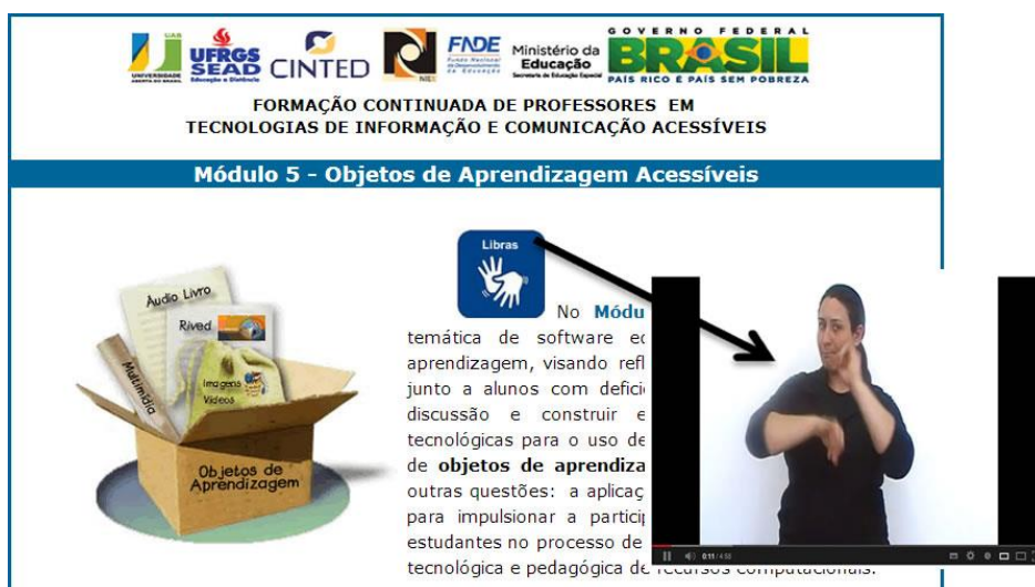
Figura 3 – YouTube – Versão em Libras, para estudantes surdos.