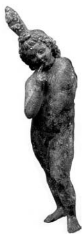
Fig. 5 - Forma helenizada do deus Harpócrates, «O Hórus criança», considerado em Alexandria filho de Serápis e de Ísis (Bronze; alt.: 25 cm; Museu Egípcio do Cairo)

A nova tríade helenística, que dominará a vida cultural alexandrina, «convidará» ainda Anúbis, o deus psicopompo, um outro deus de relevo do antigo ciclo osiriano, cujo culto se passou também a celebrar no Serapeum de Alexandria. Os quatro deuses «alexandrinos» ou do «panteão alexandrino» partirão juntos para a diáspora mediterrânica 33 . O antigo «círculo osiriano» transferiu-se, portanto, quase integralmente para o círculo «familiar» do deus Serápis, o que constituiu um elemento suplementar de apelo para os devotos egípcios e resultou da atenção particular do poder político pela camada cultural indígena.