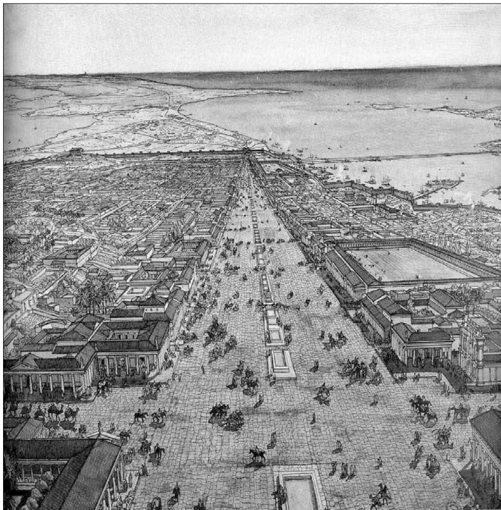
Fig. 3 – Alexandria, com a Via Canópica em destaque. Ao fundo, à esquerda, na parte mais elevada a oeste da cidade (a colina de Rakotis), vê-se o Serapeum, no enfiumento do Porto Eunostos e do Magnus Portus da capital lágida