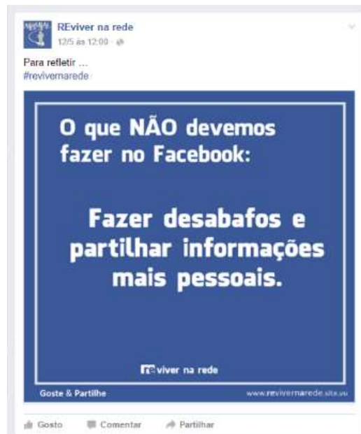
Figura 5 - Meme sobre Facebook e Redes Sociais

Estas mensagens, algumas com algum humor e outras mais sérias, tentam promover uma reflexão sobre estes assuntos, como mostra a figura 5.