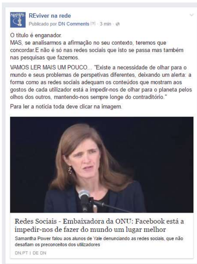
Figura 12 - Partilha de uma notícia

Estas publicações assumem uma vertente de curadoria de conteúdos como forma de “distribuir a informação que recolhemos, depois de a termos aperfeiçoado e contextualizado o conhecimento implícito, para melhorar a sua credibilidade e atender às necessidades” (Rheingold, 2012, p. 249) do público-alvo do nosso projeto. Sublinhamos que o conceito de curadoria de conteúdos caracteriza-se pelo processo de pesquisar, organizar e recolher os melhores conteúdos (textos, fotos, vídeos, ferramentas, posts , etc.) sob um determinado tema e partilhá-los. É recomendado tentar reinterpretar o conteúdo em causa, de forma a acrescentar valor e a torná-lo mais apelativo, tendo em conta o contexto em que é partilhado. Assim, a curadoria é um processo que se torna num “catalisador e facilitador à aprendizagem de outros indivíduos” (Tavares, 2013, p. 13).