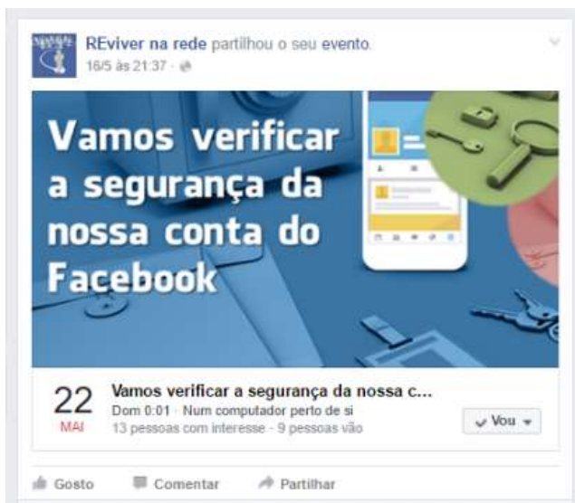
Figura 11 - Evento criado pela página

Uma outra forma de utilizar os eventos do Facebook é na divulgação de eventos de outras entidades, como o caso de quando associámos os espaços do projeto no Facebook a um evento de uma videoconferência de um especialista em redes sociais, por exemplo, com a temática “O que há de novo no Facebook”, realizada através do Facebook Live .