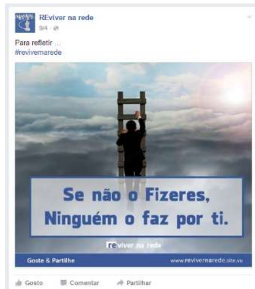
Figura 6 - Meme Generalista

Os “ Memes Generalistas ” consistem em imagens com frases com o objetivo de transmitir uma carga positiva e motivadora, como a figura 6 exemplifica; pretende-se que sejam promotoras da resiliência, “capacidade de defesa e recuperação perante fatores ou condições adversos” (Dicionário da Língua Portuguesa, 2003), muito necessária às pessoas em situação de desemprego como é o público-alvo do projeto.