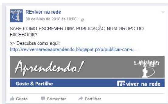
Figura 1 - Partilha dos conteúdos do website (exemplo)

O website do projeto é o local onde se encontra a maior parte dos conteúdos de aprendizagem, na sua grande parte compostos por textos com alguma dimensão, característica desaconselhável para serem escritos diretamente numa rede social. Assim, aproveita-se a existência destes conteúdos num espaço online para os partilhar nos espaços do projeto no Facebook, como é exemplificado nas figuras 1, 2 e 3. Este tipo de partilha consiste numa imagem, acompanhada por um pequeno texto introdutório, de leitura rápida e convidativa para aceder a um link da página do website , onde se encontram os conteúdos de aprendizagem (mais) completos sobre o tema em causa.