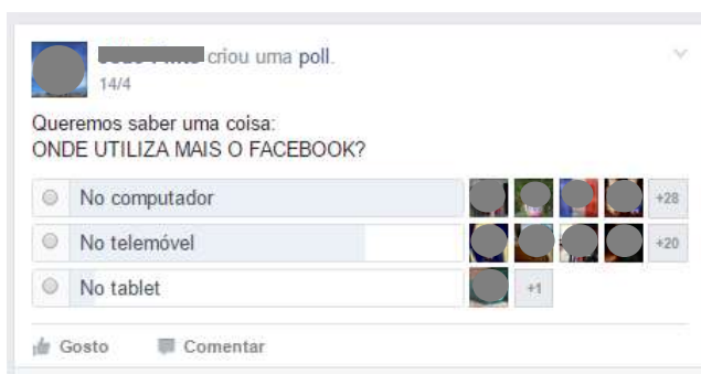
Figura 15 – Pergunta de sondagem

Utilizamos esta ferramenta para dinamizar a atividade do grupo em torno das temáticas do projeto, conhecermos melhor os membros, além de, entre outros aspetos, auscultarmos a sua opinião sobre determinados assuntos, a fim de construirmos outros conteúdos ou redefinirmos estratégias de interação. Na figura 15 apresentamos um exemplo de uma Pergunta de Sondagem, onde questionamos os membros do grupo sobre o equipamento que utilizam para aceder ao Facebook.