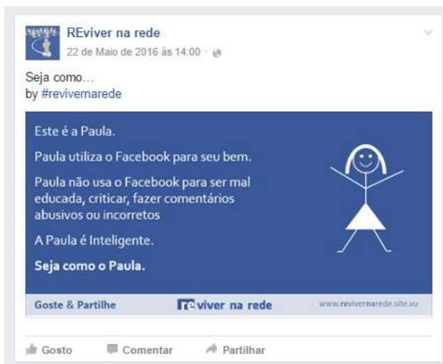
Figura 4 - Meme "Seja Como..."