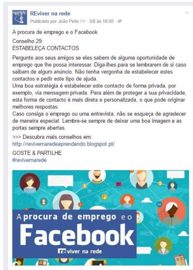
Figura 3 - Partilha dos conteúdos do website (exemplo)