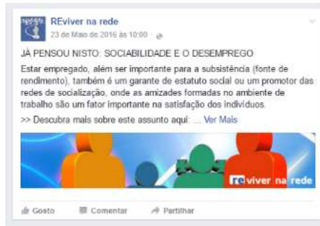
Figura 2 - Partilha dos conteúdos do website (exemplo)