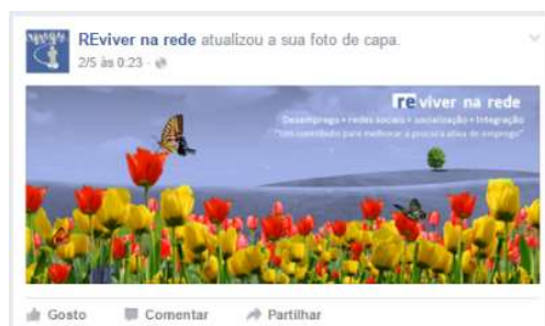
Figura 14 – Atualização da capa da página no Facebook

A foto de capa é uma imagem situada no topo de uma página ou grupo no Facebook e tem como objetivo ilustrar o seu aspeto; deve relacionar-se com a temática em causa e “pode ser alterada com frequência” (Coutinho, 2014, p. 100), de forma a maximizar o impacto junto dos seus visitantes. Assim, estabelecemos uma estratégia de dinamização da foto de capa da nossa página, alterando-a a cada mês ou em ocasiões especiais (por exemplo: Páscoa, Natal, início da primavera, dia da Região da Madeira), de forma a aumentar o envolvimento e a empatia do público com o projeto. As imagens utilizadas são tratadas de forma a incluírem alguns elementos gráficos definidos para o projeto, como a cor azul e o logótipo, além de algumas frases alusivas ao projeto como o respetivo Mote / Lema. A figura 14 mostra uma imagem de capa da página do Facebook com uma temática gráfica alusiva ao mês de maio.