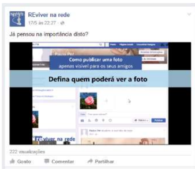
Figura 10 - Publicação de um vídeo do tipo tutorial

O vídeo é um recurso “audiovisual que pode contribuir para a compreensão, permite a reflexão de uma forma frequentemente superior, pela sua riqueza, àquela que é possível apenas com a palavra escrita” (Chambel & Guimarães, 2000, p. 5). Estes autores defendem que os vídeos são adequados para espaços abertos de suporte à aprendizagem, onde existe liberdade de ação e um incentivo à tomada de iniciativa para aprender. Estes podem ser utilizados “para motivação, ilustração de conceitos ou experiências, como veículo principal de informação, como uma ferramenta para experiências” ( idem ), além de poderem simular situações e procedimentos necessários para realizar determinadas tarefas, como é o caso do tutorial em vídeo exemplificado na figura 10, também disponível online em https://youtu.be/BugXK5dkXyw .