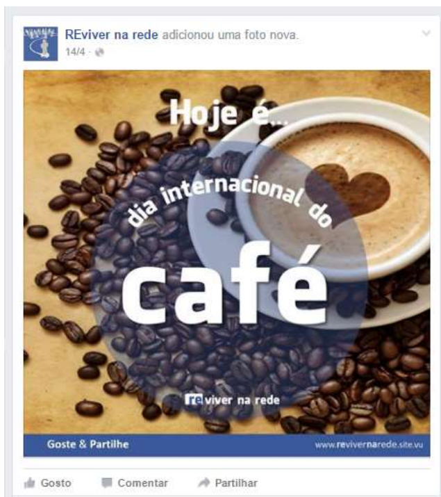
Figura 7 - Meme sobre Dias Especiais

Os “ Memes Dias especiais” consistem numa publicação alusiva aos dias com algum significado especial, tais como, entre outros: “Dia Internacional da Mulher”; “Aniversário do Facebook”; “Dia Mundial do sorriso”; “Dia da Internet Segura”; ou o “Dia do Café”, referido na figura 7. Estas publicações também têm um carácter lúdico e pretendem contribuir para o reforço da relação emocional com os seguidores da página.