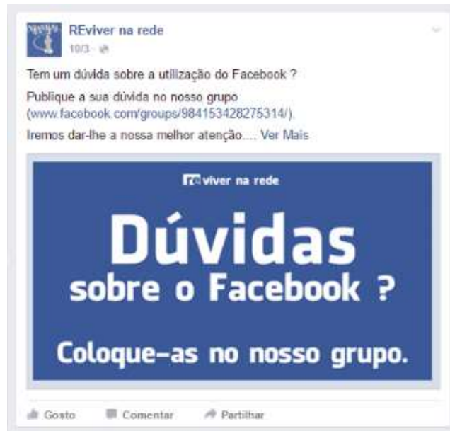
Figura 8 - Flyer para promover a interação no grupo