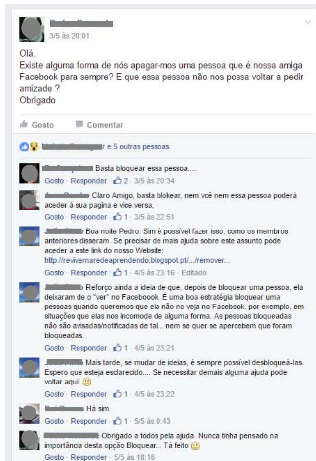
Figura 9 - Colocação de uma dúvida por um membro no grupo do Facebook do projeto