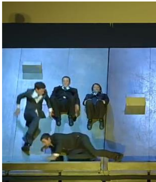
Fig. 4 - Plan B . Print 1 cena do espetáculo. Aurélien Bory (2003).

No espetáculo Plan B , 2003, do coreógrafo francês Aurélien Bory ( Plan B - Aurélien Bory / Phil Soltanoff , 2014), há o interesse direto no efeito de subversão da gravidade, que é obtido principalmente pela inclinação de placas de madeira que formam o cenário, no qual os dançarinos interagem. Aparentando uma parede vertical, à primeira vista, a rampa de madeira inclinada permite adesão do corpo, controle da velocidade de escorregamento, cambalhotas no ar, saltos impossíveis para cima e outras manobras surpreendentes, pois a ilusão é de que aqueles bailarinos estão realizando tais peripécias nas mesmas condições gravitacionais em que a plateia também se encontra (Fig. 4).