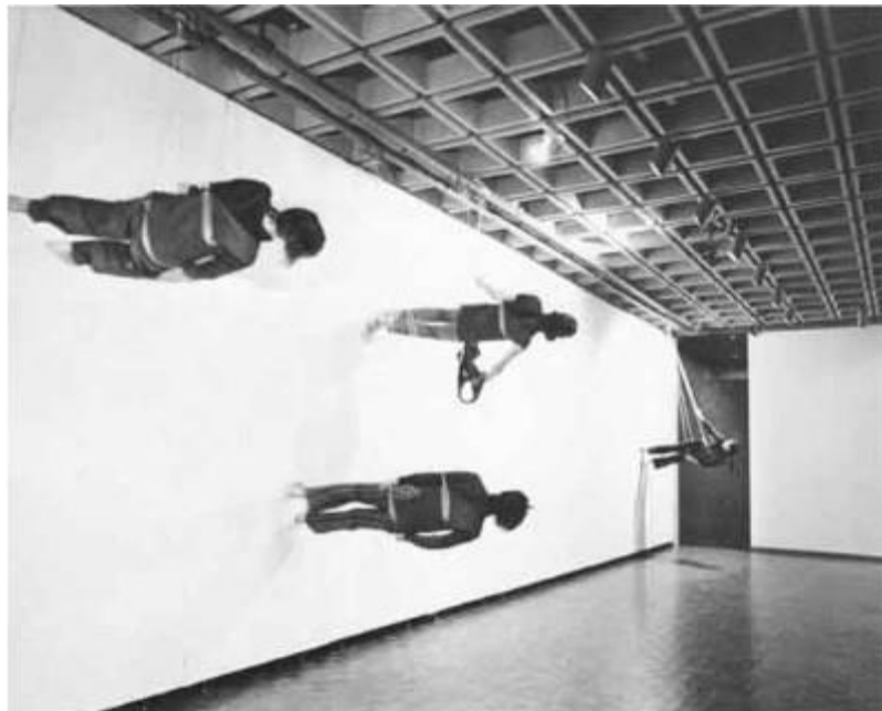
Fig. 3 - Walking on the wall . Trisha Brown (1971). Audiodescrição da imagem: Foto em tons de cinza em que se observam 4 pessoas caminhando de um lado ao outro pela parede de uma sala, seguras por cordas.

Na performance Walking on the Wall (1971), Fig. 3, performers caminham em deslocamento horizontal (Trisha Brown's Walking on the Wall at the Barbican , 2011). Cada performer está ligado a cordas presas nos trilhos fixados no teto, pelo qual roldanas deslizam, numa logística mais complexa do que a da performance anterior.