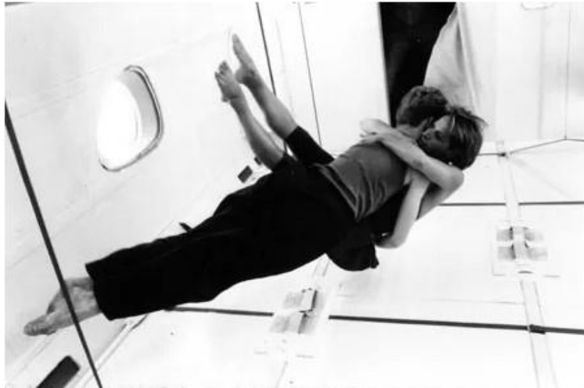
Fig. 1 - Kitsou Dubois e dançarino em voo parabólico.

Kitsou Dubois ( A World without gravity - Um film de Kitsou Dubois, 2022) foi pioneira na investigação de movimento em voos parabólicos 3 (Fig. 1). A tecnologia para viagens espaciais se intensificou nos anos seguintes, aumentando as viagens tripuladas em diversos propósitos artísticos e científicos.