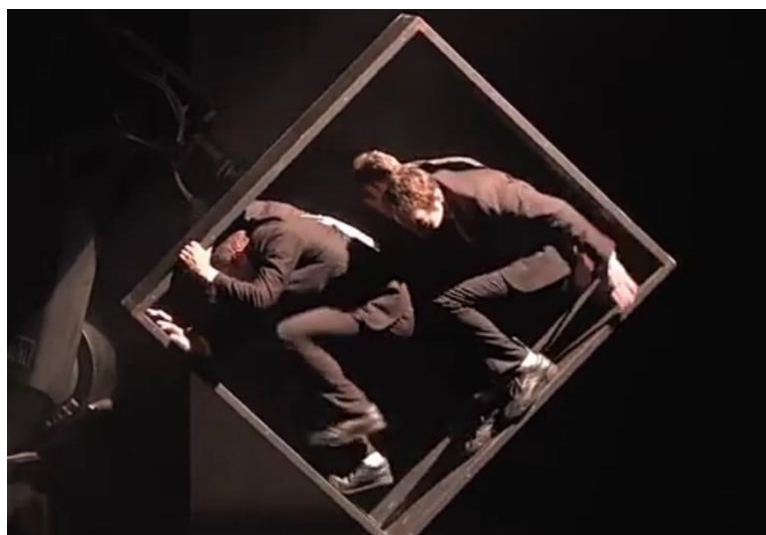
Fig. 9 - Sans Objet . Aurélien Bory (2009).

Na obra Sans Objet , de Aurélien Bory (2009), um cubículo giratório e espelhado entra em cena, desafiando os dois bailarinos, que mal cabem ali, a manterem-se em movimento dentro daquela moldura. (SANS OBJET - Pièce d'Aurélien Bory, 2015). Fig. 9.