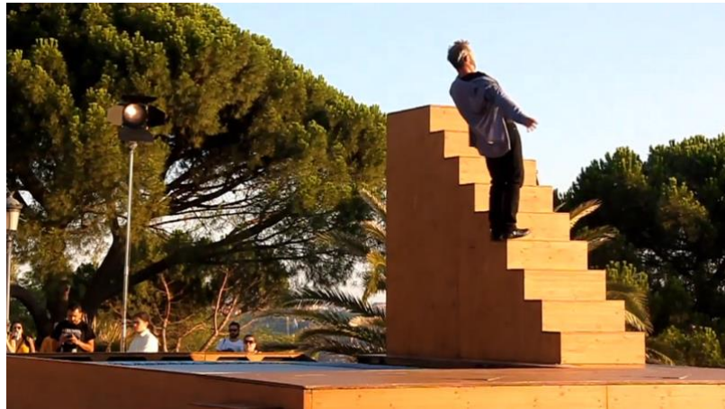
Fig. 19 - Fugue trampoline. Yoann Bourgeois (2018)

lançamento do corpo de volta à posição bípede é inesperado; assemelha-se a algo visto apenas pela mediação de recursos audiovisuais, como o rebobinar de uma cena de queda. Fig. 19.