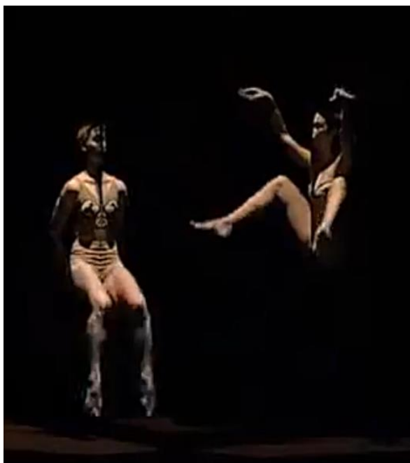
Fig. 8 - Shazam . Fonte: Print da cena . Philippe Decouflé (1998).

É através de espelhos que Philippe Decouflé leva o público a duvidar do que vê diante dos seus olhos, em uma das cenas do espetáculo Shazam , de 1998 (Philippe Decoufle - Shazam , 2020). Grandes espelhos estão posicionados sobre o palco como paredes, embora não estejam visíveis para a plateia, devido ao efeito de iluminação. Bailarinas posicionam-se em pé, com metade do corpo visível e outra metade oculta atrás do próprio espelho, de forma a que o reflexo do corpo simétrico provoque a impressão de que vemos o corpo inteiro.