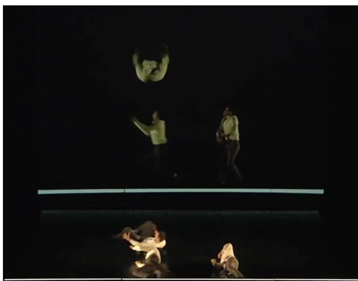
Fig. 5 - Plan B . Print 2 cena do espetáculo. Aurélien Bory (2003).

Em outra cena do Plan B (Fig. 5), os bailarinos estão em movimento no chão, com sua imagem capturada por uma câmera posicionada acima deles (no teto do palco) e projetada na vertical, causando na plateia a impressão de que estão em pé. Os movimentos simulam lutas, equilíbrios e saltos no ar impossíveis na posição bípede, mas realizáveis na horizontal. A cena joga com o imaginário cinematográfico e de desenhos animados nos quais é possível subverter a gravidade. Uma característica desta cena é a mediação da câmera como principal fator de subversão da gravidade.