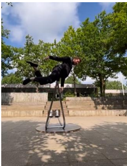
Fig. 17 - Weightlesse device. Print da postagem. Bastien Dausse (2023)

Audiodescrição da imagem: Foto colorida, fundo preto. Mulher branca com vestido comprido vermelho gira.