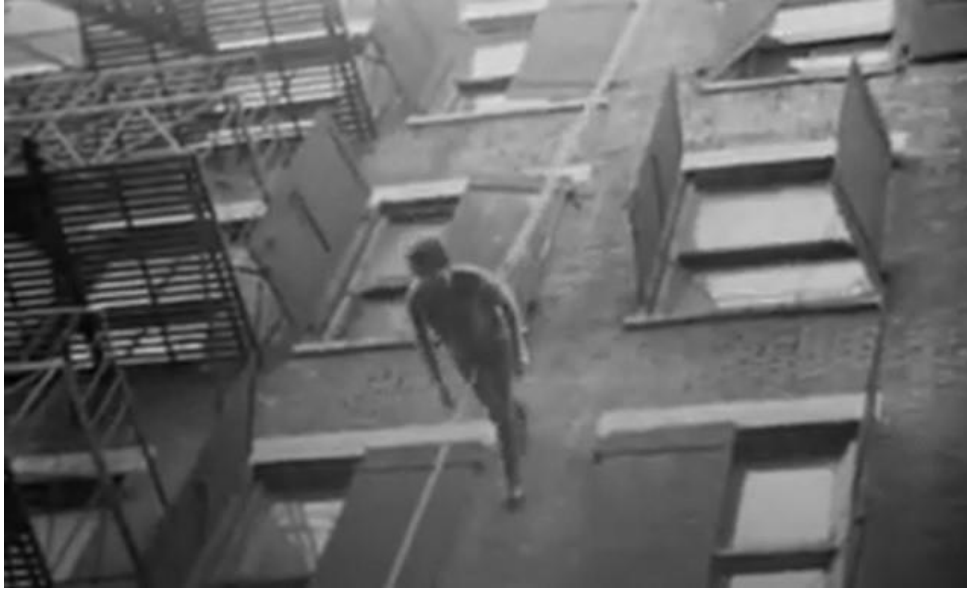
Fig. 2 - Man Walking Down The Side of a Building . Trisha Brown (1970). Audiodescrição da imagem: Foto em tons de cinza em que se observa uma mulher caminhando face ao chão, em descida pela parede de um grande prédio, segura por cordas.

Na performance Walking on the Wall (1971), Fig. 3, performers caminham em deslocamento horizontal (Trisha Brown's Walking on the Wall at the Barbican , 2011). Cada performer está ligado a cordas presas nos trilhos fixados no teto, pelo qual roldanas deslizam, numa logística mais complexa do que a da performance anterior.