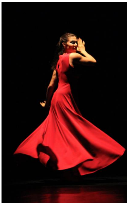
Fig. 16 - Frágil, Ideias de teto. Clara Trigo (2009)

Audiodescrição da imagem: Foto colorida, fundo preto. Mulher branca com vestido comprido vermelho gira.