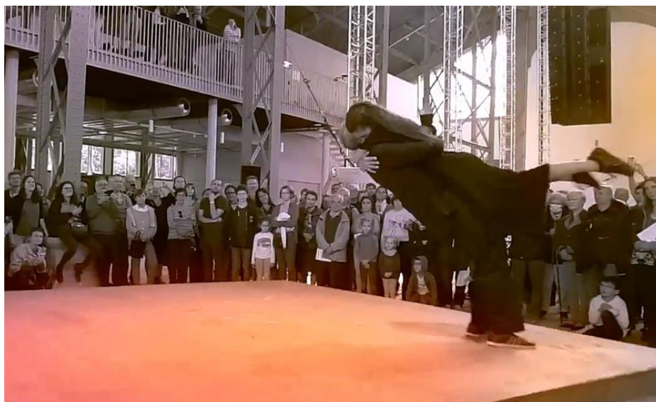
Fig. 15 - Celui qui tombe. Print da cena. Yoann Bourgeois (2022)

massas sejam lançadas tangencialmente para fora da curva, provocando o efeito de horizontalidade no corpo, como uma espécie de voo.