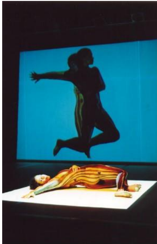
Fig. 6 - Corpo aberto . Ivani Santana. (2001).

Audiodescrição da imagem: Foto colorida em que se observam uma mulher deitada num palco, dentro de um quadrado de luz. Essa mesma cena é projetada na vertical, na parede do palco, com a diferença de vermos o corpo multiplicado por uma imagem em tempo real sobre uma imagem fotográfica na mesma posição. A posição de pernas dobradas dá a sensação de que a mulher flutua no ar.