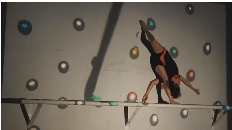
Fig. 7 - Estudo para lesma . Fonte: Print cena . (2012).

Audiodescrição da imagem: Foto colorida em que se observa uma mulher branca encostada à parede, de cabeça para baixo, sobre uma barra de ferro branca, longe do chão. Na parede estão projetadas gotas coloridas de verde, azul, amarelo, vermelho, pintadas em tempo real.