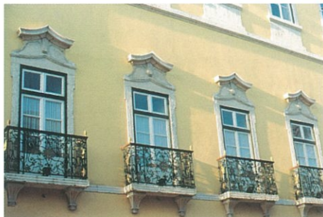
[Fig.6] – Fachada pormenor, janelas do andar nobre

20 Recupera a tipologia ou modelo joanino referenciando-se na casa nobre Ludovice a São Pedro de Alcântara. Veja-se A Sétima Colina. Roteiro Histórico-Artístico , Lisboa, Livros Horizonte, 1994.