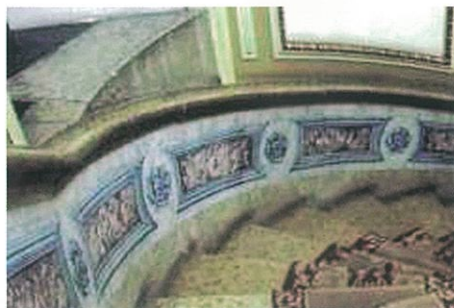
[Fig.7] - Pormenor da Escadaria, Foto Universidade Aberta

Por fim, se por um lado a sua estrutura se integra no esquema de construção e na própria relação da rua onde se insere, o mesmo não acontece com a sua gramática decorativa, especificamente concentrada na fachada de grande expressividade autónoma. Ultrapassando o