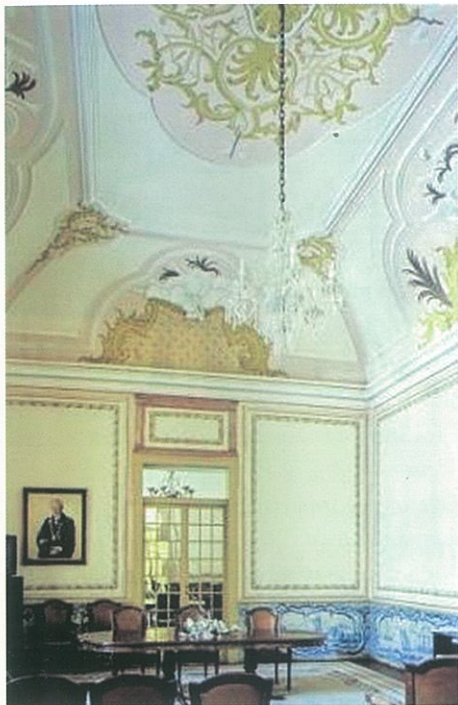
[Fig.2] – Palácio Rebelo de Andrade – Ceia, salão nobre

uma carga simbólica e uma conotação significativas, imponentes, erguidos para albergar a aristocracia de corte, cujo elemento palaciano barroco mais evidente é, para além da dimensão, a existência de aparatosas escadarias interiores e a introdução de um ritmo de fachada pela adopção de elementos decorativos, pensamos que para este caso, nos encontramos perante uma construção nobre pelo seu proprietário e até mesmo por algumas marcas na sua construção, mas de proporções modestas, mais especificamente casa(s) nobre(s) como eram designadas pelos seus contemporâneos 11 .