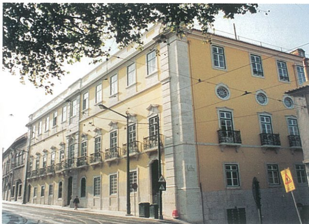
[Fig.5] – Palácio Rebelo de Andrade – Fachada