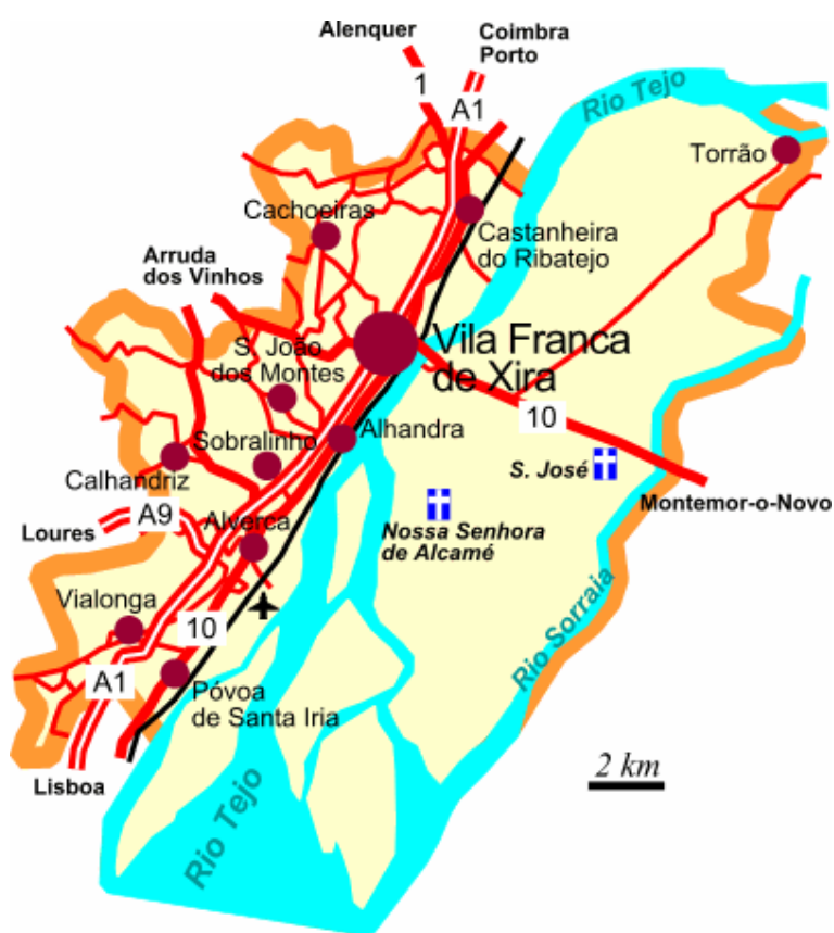
Figura 3: Mapa do concelho de Vila Franca de Xira. (disponível em http://viajar.clix.pt/com/geo.php?c=183&mg=1&lg=pt )

situam as nossas escolas: A Escola Básica do 1º ciclo nº 3 e a Escola Básica do 1º ciclo nº 4, conforme se pode ver nos mapas que se seguem.