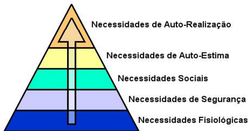
Figura 1: Hierarquia das Necessidades. (In site wikipédia disponível em http://pt.wikipedia.org/wiki/Abraham_Maslow )

Em 1954, Abraham Maslow defendeu a teoria da hierarquia das necessidades. Segundo este psicólogo americano, o ser humano apresenta, ao longo da sua vida, diversas necessidades que podem ser agrupadas em cinco categorias/níveis. Estas necessidades apresentam-se segundo uma hierarquia de influência e predominância. Maslow apresentou esta hierarquia numa pirâmide, correspondendo a base às necessidades mais baixas, ou “primárias”, e o topo às necessidades mais elevadas, necessidades “secundárias”. Segundo o autor esta distinção de necessidades dever-se-ia ao facto das necessidades secundárias serem «...satisfeitas internamente (dentro da própria pessoa), enquanto as de ordem inferior são, predominantemente, satisfeitas externamente...» (Seco, 2000, p. 98). Para Maslow, as necessidades secundárias não se manifestam enquanto as necessidades primárias não se encontrarem satisfeitas (ibidem). À medida que se vão satisfazendo necessidades de ordem inferior, outras, de ordem superior se vão manifestando.