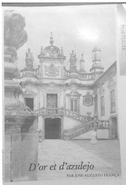
Fig. 2. FRANÇA, José-Augusto (1987). "D'or et d'azulejo". Le Courrier, Le Baroque , Paris, n.º 9, pp. 27-30.

aquilo que se chamou os "panos pintados", isto é, a pintura decorativa das paredes, pintavam reposteiros nas paredes, não havia o reposteiro, havia a pintura do reposteiro com a representação de cordões e tudo... e há muita coisa dessas nos palácios de Lisboa, Palácio Olhão a Santa Apolónia, o Palácio dos Cunhas... Quando eu estive lá conheci uma velhas senhoras que lá habitavam duas irmãs, tias do Marquês de Olhão na altura, que quiseram vender o Palácio ao Estado, para um Museu, mas a coisa não se concretizou, mas eu visitei longamente o Palácio que tinha uma sala lindíssima... confluência de gostos... que nessa altura tem importância em Portugal, tem... É essa a ambiência do interior decorativo, juntamente com os estuques.