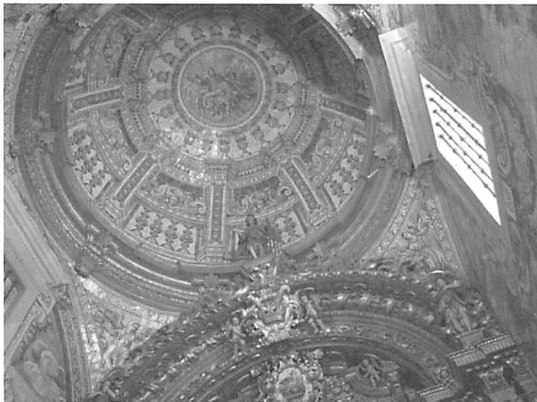
Fig. 4. Cúpula. Detalhe da Igreja de São Lourenço de Almancil, Loulé, Algarve, Repertório Fotográfico e Documental acedido http://www.queirozportela.com/ipc.htm

- Qual é o azulejo da sua vida, qual é a sua preferência cronológica?