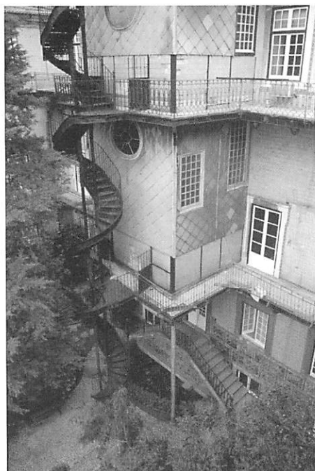
Fig. 5. Palácio Rebelo de Andrade – Ceia, fachada tardoz, escada em ferro, meados do século XIX