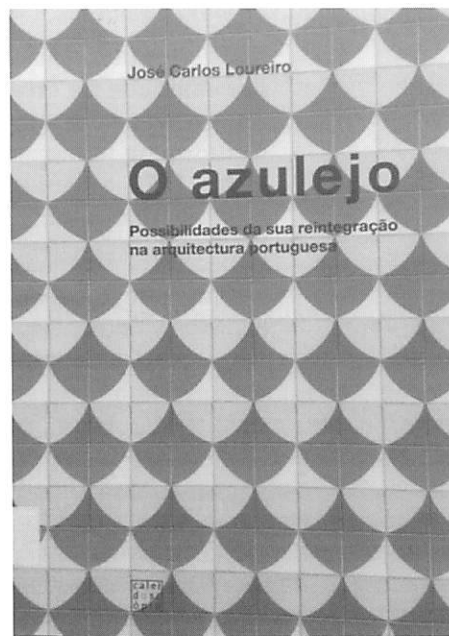
Fig. 3. LOUREIRO, José Carlos (1962). O Azulejo. Possibilidade da sua reintegração na arquitectura portuguesa, Porto.

Quer destacar alguns momentos em que privou com ele? E o que retém hoje desta importante figura e do seu contributo para o estudo do azulejo no espaço português?