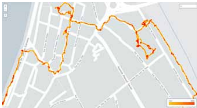
Figura 3 – Mapeamento do tempo e velocidade de uma deriva urbana pela vila de Caminha.

O mapeamento da experiência destas derivas urbanas, como meio de apreensão da vila de Caminha, procura aprofundar a relação entre percepção espacial e temporal do espaço urbano, compreendendo e representando experiências realizadas.