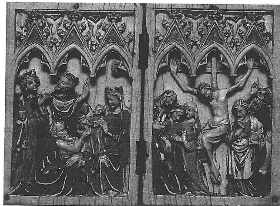
Fig. 3 – “Adoração dos Magos e Crucificação” Díptico de Marfim – França – séc. XIV Museu Calouste Gulbenkian – Lisboa