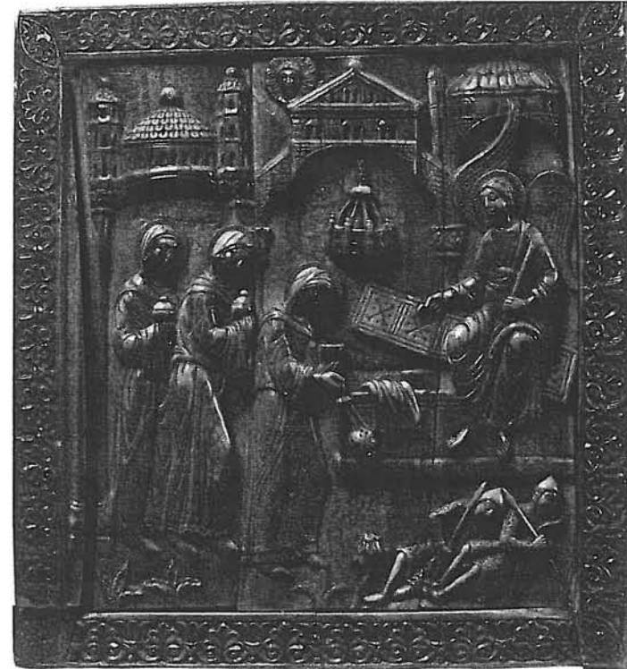
Fig. 1 – “Três Santas Mulheres no túmulo de Cristo” Placa de Marfim – Colónia – século XII Metropolitan Museum of Art – Nova Iorque