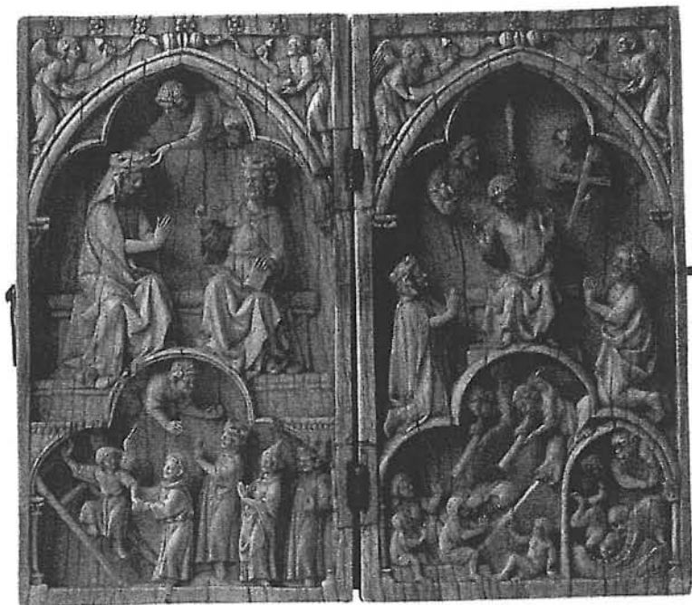
Fig. 2 – “Coroamento da Virgem e Julgamento Final” Díptico de Marfim – Paris – século XIII Metropolitan Museum of Art – Nova Iorque