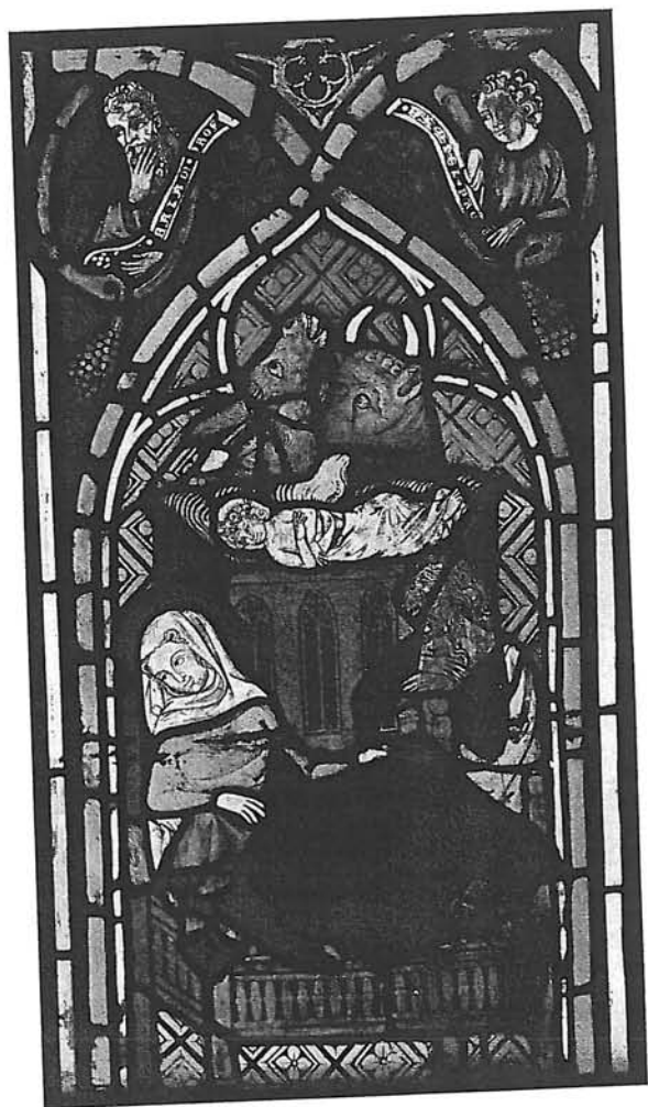
Fig. 6 – “Nascimento de Cristo com Profetas” Vitrail na cabeceira da igreja – séc. XIV Igreja de Nossa Senhora de Esslingen – Alemanha