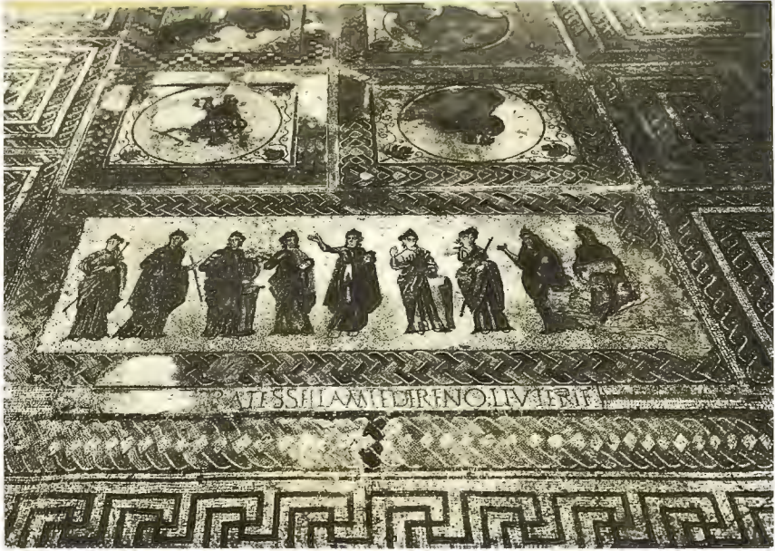
Fig. 10 – “Mosaico das Musas”, da villa romana de Torre de Palma (Monforte), reproduzido em postal do Museu Nacional de Arqueologia editado na época de Manuel Heleno.

4 – Muitas outras intervenções arqueológicas de primeira importância de Manuel Heleno poderiam ser referidas, como as que conduziu nos concheiros mesolíticos do vale do Sado (Fig. 11), por ele explorados em final de carreira, no decurso da segunda metade da década de 1950 e da primeira metade da década seguinte, com o intuito de obter elementos de comparação com os célebres concheiros de Muge, celebrizados internacionalmente aquando da realização em Lisboa da IX Sessão do Congresso Internacional de Antropologia e de Arqueologia Pré-Histórica, em 1880 (CARDOSO, 2019).