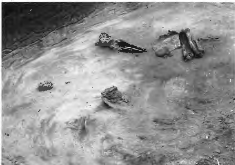
Fig. 11 – Vista parcial da escavação realizada em 1960 no concheiro mesolítico de Poças de São Bento (Alcácer do Sal).