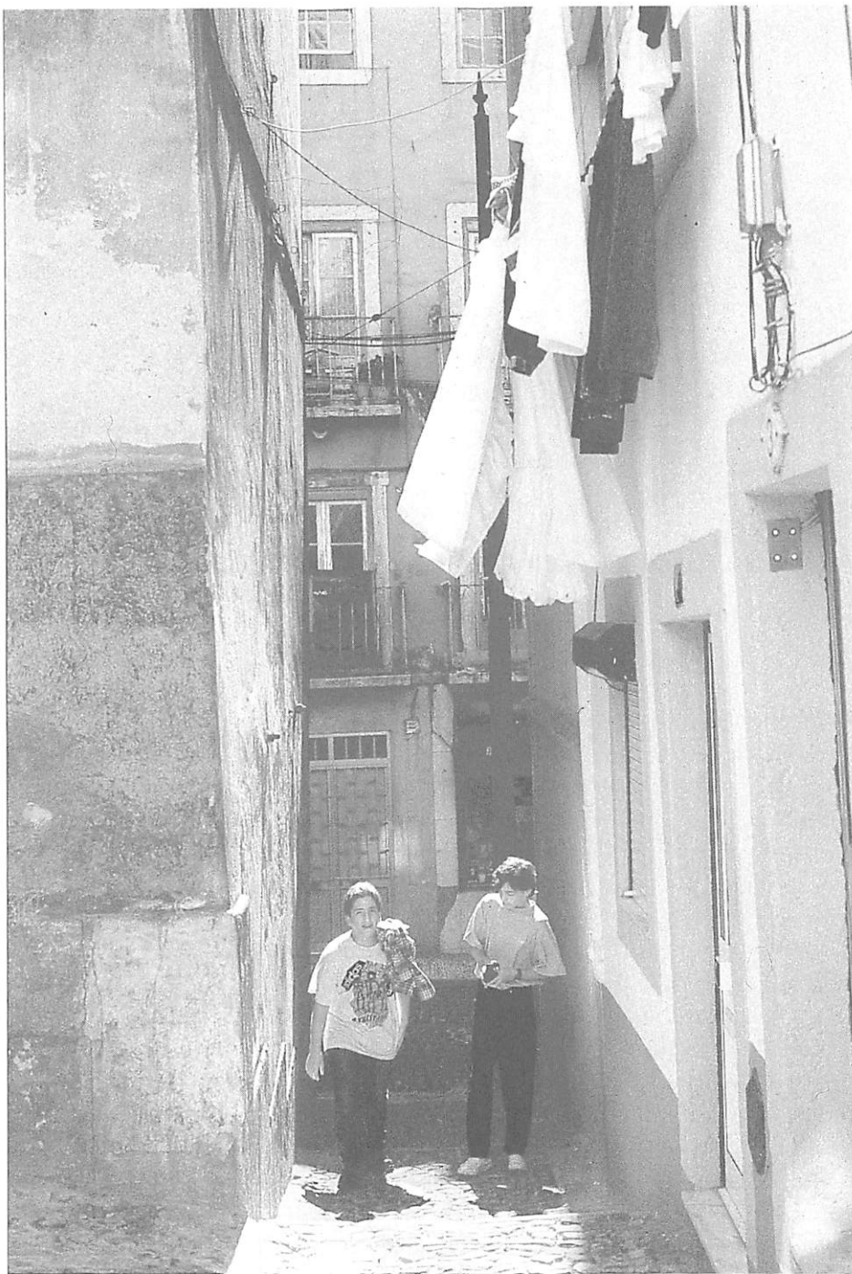
FIGURA 5 - Beco junto da Rua dos Cavaleiros