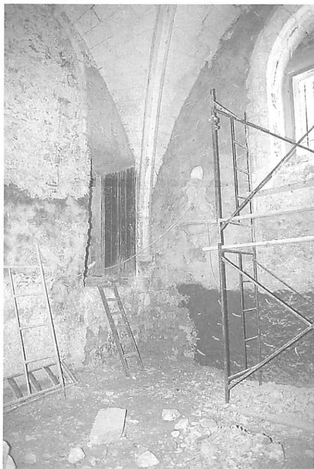
FIGURA 7 – Desentulhamento das capelas góticas (1992)

As intervenções puseram a descoberto as capelas góticas de finais do séc XIII (Fig. 7) que, em conjunto com o Claustro da Sé de Lisboa, constituem os únicos