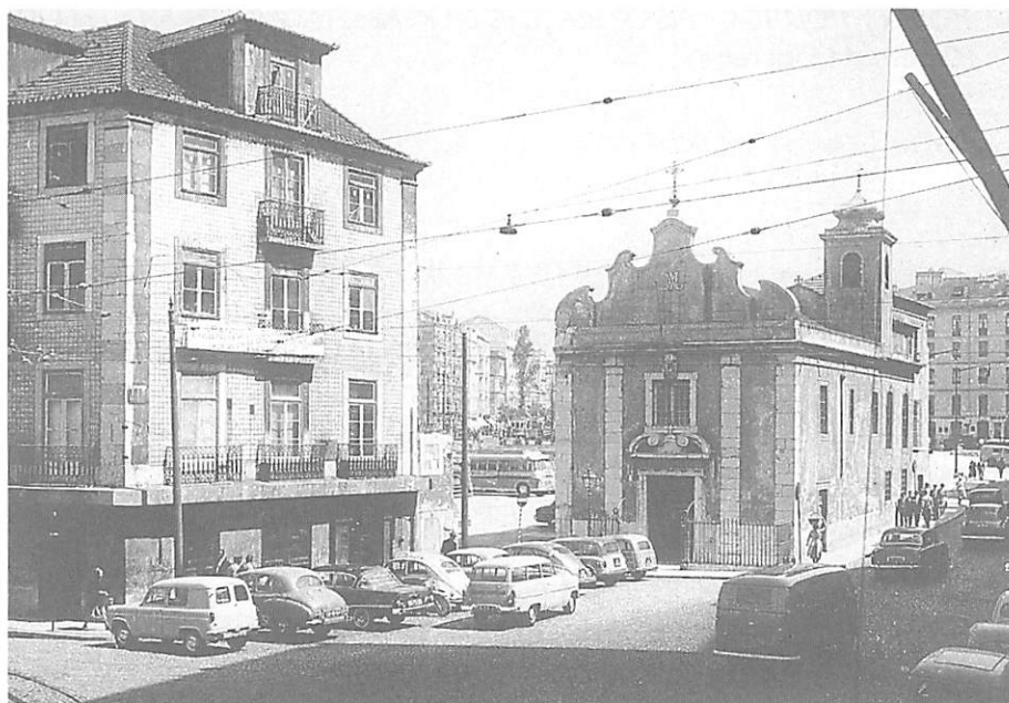
FIGURA 1 – Demolições na Mouraria na década de 50