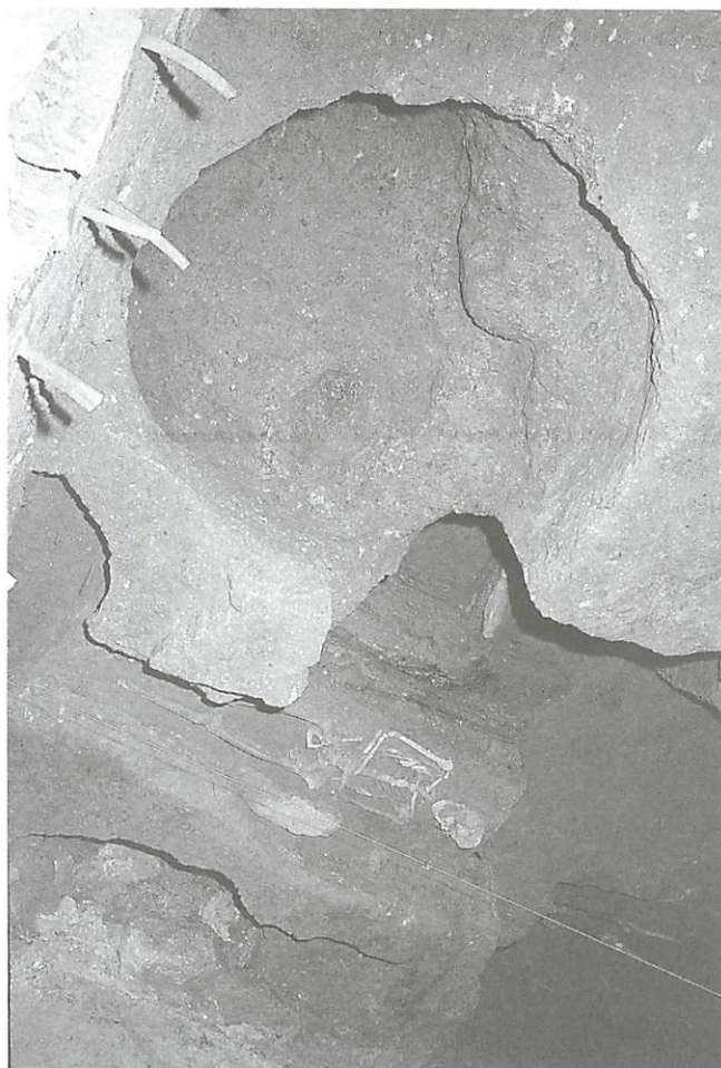
FIGURA 8 - Silos islâmicos e sepulturas medievais encontrados na capela gótica principal (1992)

Estas descobertas implicaram a reformulação da proposta inicial de simples consolidação estrutural e de restauro. Criou-se uma equipa multidisciplinar que ao acompanhar ininterruptamente todos os trabalhos, tem vindo sempre a confrontar-se com novas situações. Houve, como tal, necessidade de adoptar uma metodologia que estabelecesse diferentes níveis de intervenção e que, apesar do confronto entre vestígios de períodos diferentes, mantivesse a unidade formal do edifício. Essa mesma metodologia obrigou, também, a uma redefinição dos espaços e à análise atenta de todos os materiais, sem a qual não é possível fazer uma correcta recuperação.