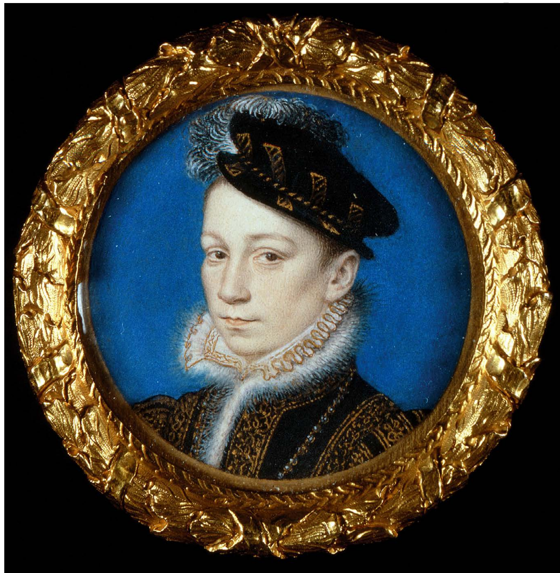
FIG. 6 François Clouet (atrib.), Portrait de Charles IX , miniature en parchemin sur carte, 4,3 cm diamètre; n° inv. RCIN 420931, Royal Collection, Non-Commercial Use of the Content (CC BY-NC-SA 4.0) / Royal Collection Trust / ©Her Majesty Queen Elizabeth II 2018.