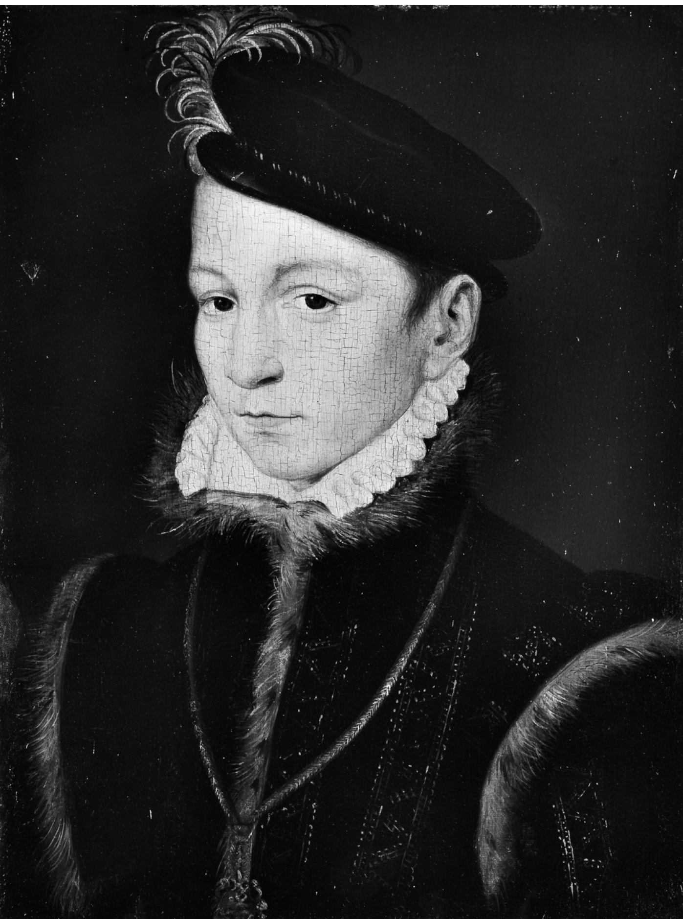
FIG. 5 François Clouet (atrib.), Portrait de Charles IX , huile sur bois, h. 31,4 cm x l. 22,9 cm; n° inv. 32100124, Metropolitan Museum, Non-Commercial Use of the Content (CC BY-NC-SA 4.0) / ©Metropolitan Museum.