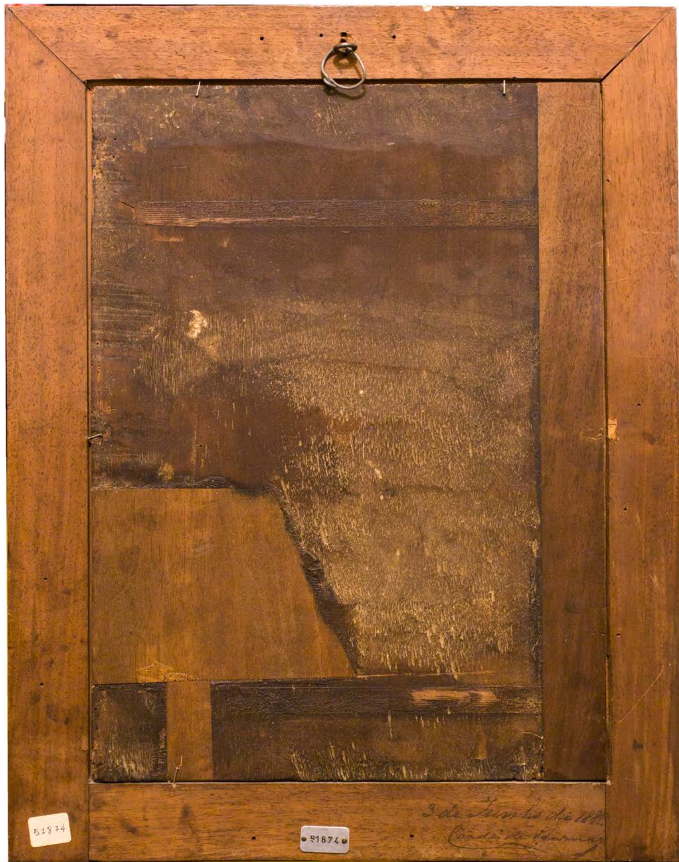
FIG. 2 Revers du Portrait du roi Sebastião avec l'inscription dans le coin inférieur gauche