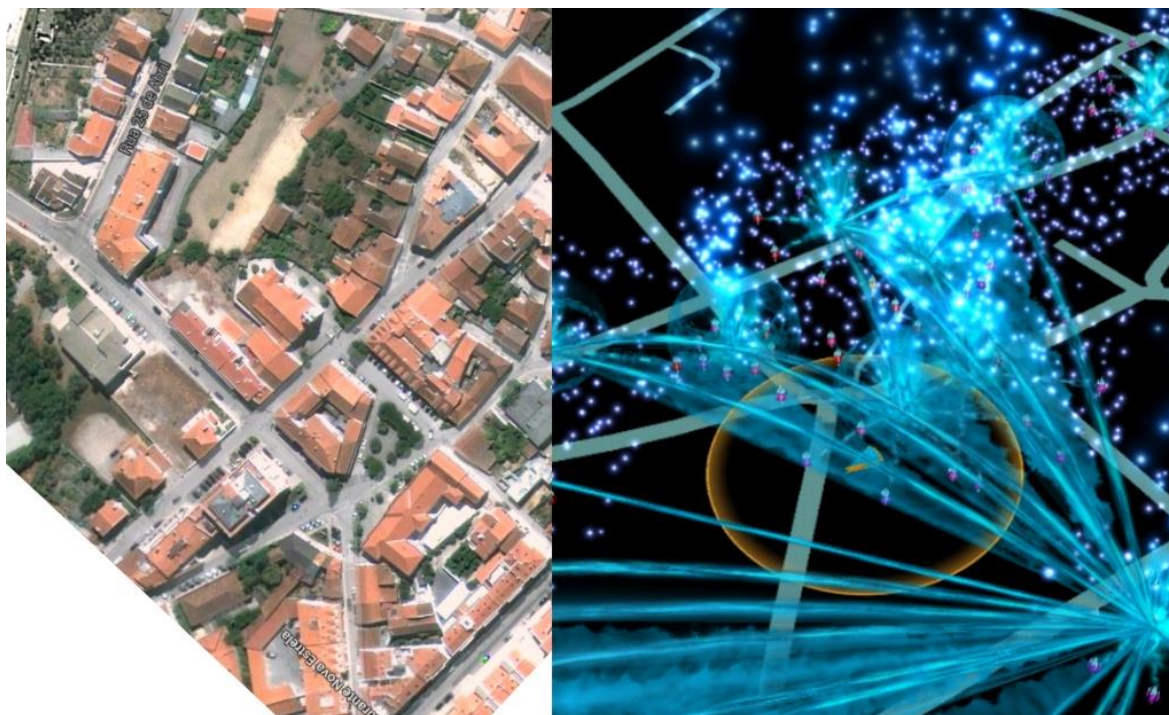
Figura 1 – A realidade alternativa do jogo Ingress vista através de um dispositivo móvel, justaposta à fotografia aérea correspondente. O triângulo central indica a posição do jogador e o círculo o seu raio de alcance. Os pontinhos são “matéria exótica”, os aglomerados são “portais”. São ainda visíveis linhas de força e campos de energia.

Morgado, Leonel (2015). Ingress – potencialidades pedagógicas de um jogo georreferenciado de realidade alternativa em rede. In J. António Moreira, Daniela Barros & Angélica Monteiro (Eds.), “Inovação e Formação na Sociedade Digital: Ambientes Virtuais, Tecnologias e Serious Games”, ISBN 978-989-8765-25-3, pp. 151-164. Santo Tirso, Portugal: Whitebooks.