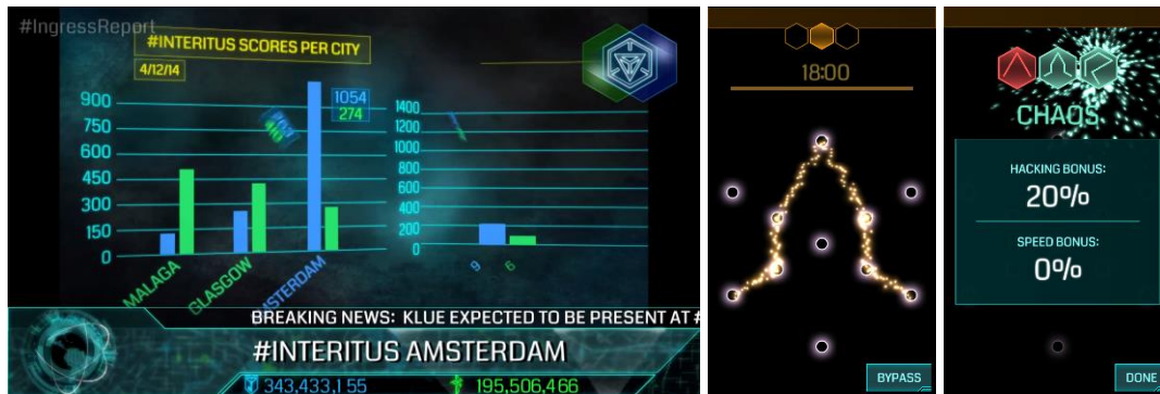
Figura 4 – a) Ingress Report, uma peça de narrativa multimédia e notícias, imagem extraída de https://www.youtube.com/watch?v=T-OS6hQqc7w ; b) Minijogo de glifos; c) Sequência de glifos.