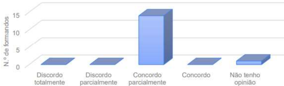
Gráfico 2. Resultados obtidos sobre a adequação da modalidade de formação aos professores da AEC.

“Esta modalidade de aprendizagem adequa-se à realidade dos professores da AEC.”