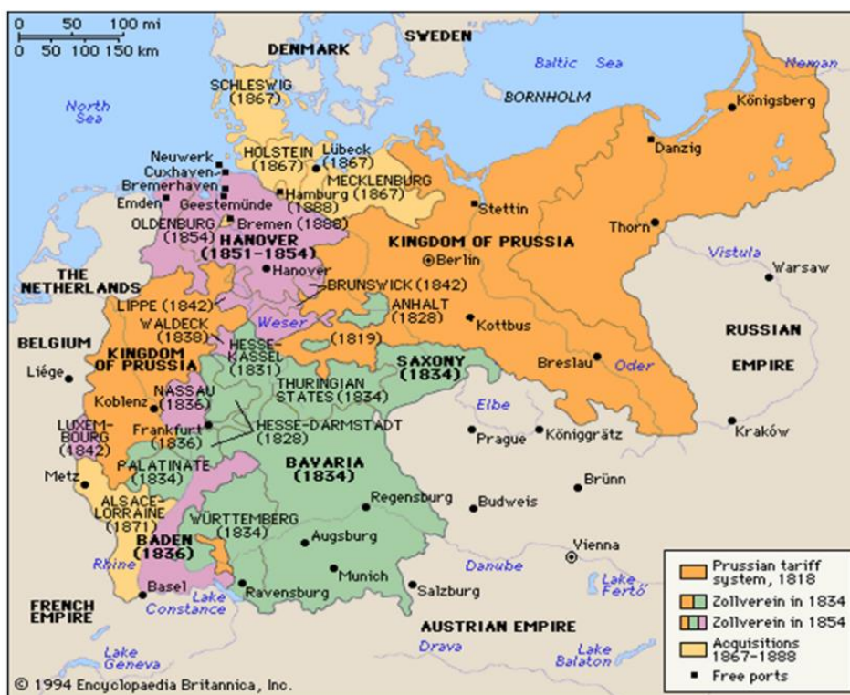
Figura 2 - Zollverein

Com isso, podemos observar no mapa a seguir a expansão do Zollverein ao longo do século XIX: