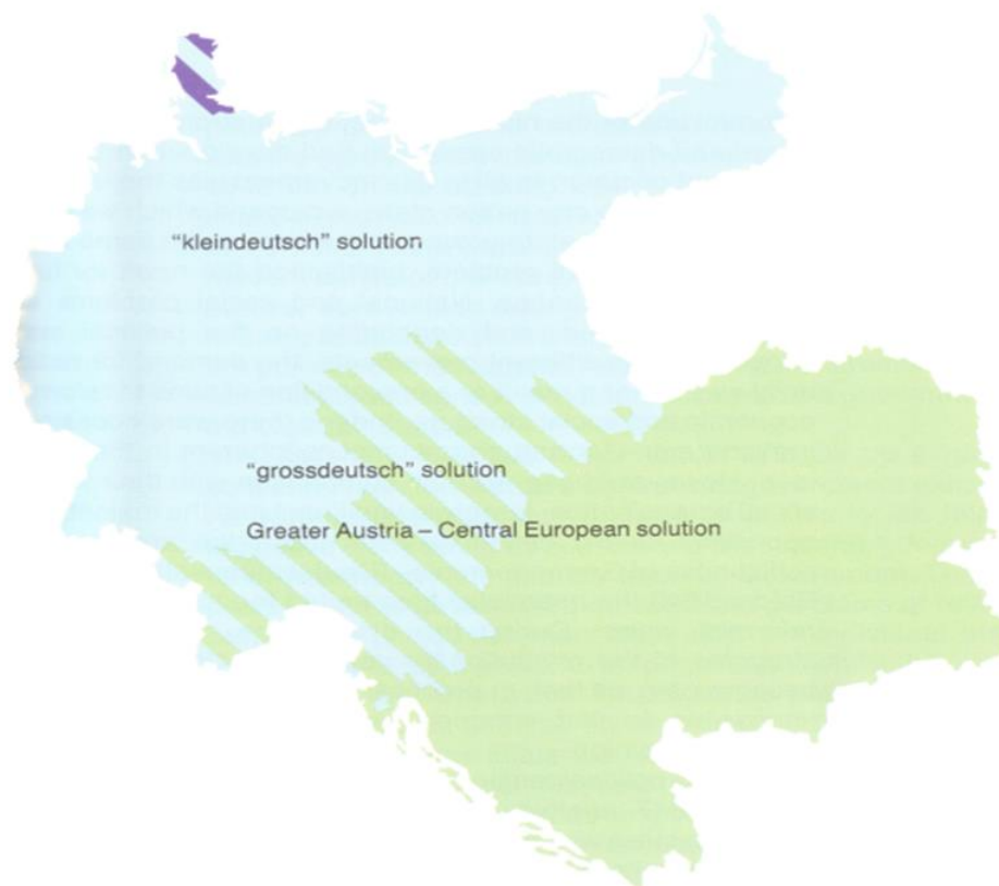
Figura 1 - A questão alemã

No mapa a seguir, podemos observar ambas as propostas: