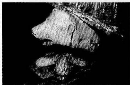
Fig. 5 - Urso representado no apoio ("cachorro") do sarcófago do rei D. Diniz, no convento de Odivelas, com o rei deitado por terra, de costas, matando a fera com punhal, tido na mão direita, que enterra no peito do animal.