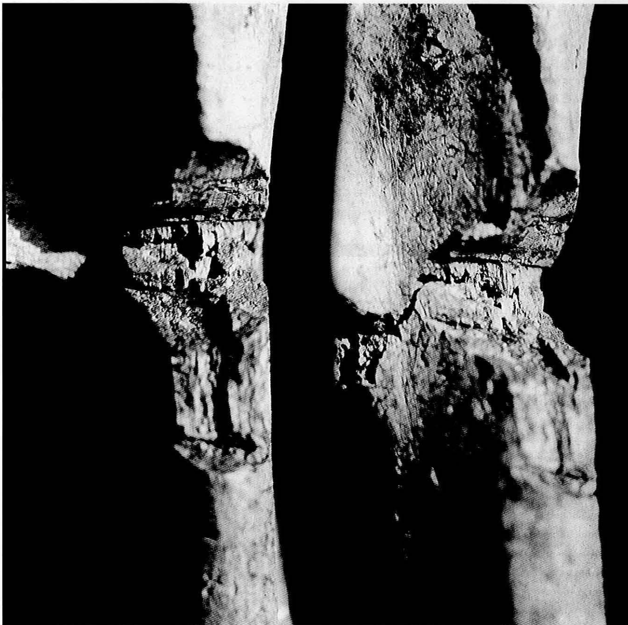
Fig. 3 - Marcas de corte por cutelo, oblíquas e convergentes, formando entalhe com perfil em V destinado ao seccionamento do osso ao nível da articulação com o húmero (cotovelo), observadas no bordo posterior.