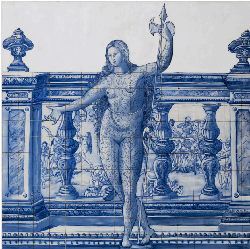
Fig. 6. Figura de Convite I , 1997, Adriana Varejão, óleo sobre tela 200 x 200 cm

Em quase toda a historiografia do século XX, as promissoras relações do azulejo com a arquitetura acabaram por se mostrarem estanques, presas em classificações tipológicas, normalmente atribuídas ao trabalho ingénuo dos mestres ladrilhadores.