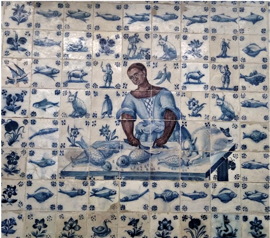
Fig. 4. Escrava negra a amanhar o peixe , 1ª metade do século XVIII. Palácio Sousa Mexia, Museu de Lisboa.

da criatividade e do génio dos pintores de azulejo portugueses, também elogiados pela criação de uma original expressão pictórica cerâmica.