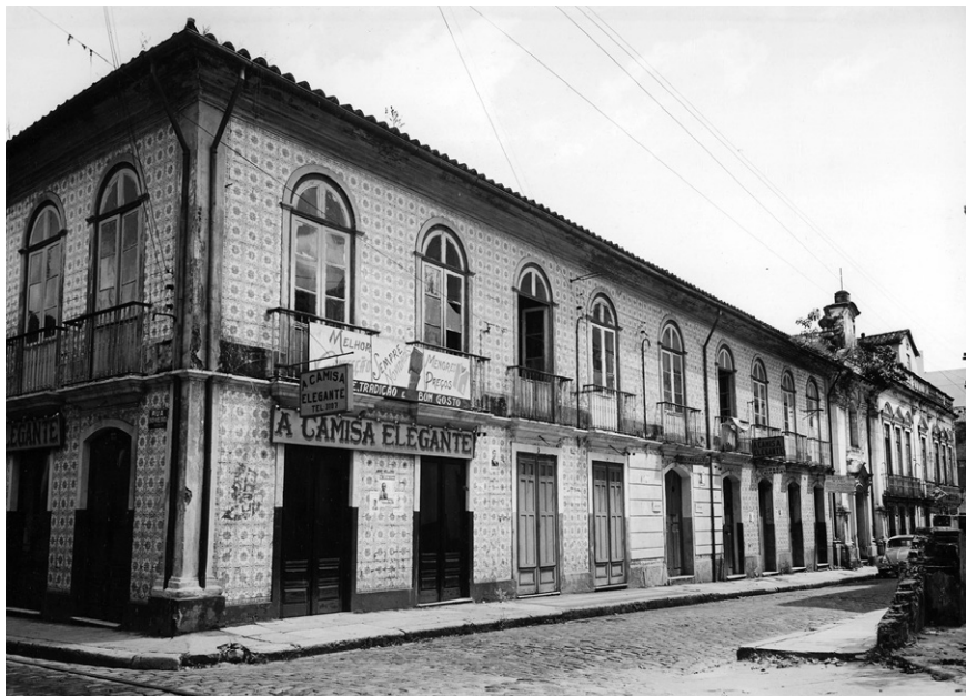
Fig. 1. Azulejos de fachada do edifício na Rua Campos Sales, Belém, Brasil.

fachadas das nossas casas será o comêço de uma decadência prematura; convirá destruir esta introdução ou aproveitá-la com melhor direção na decoração externa? Será melhor combatê-la rigorosamente para substituir êste gôsto dos habitantes pela pintura a fresco, pelo desenho chamado “sgrafitado”, pelo estuque, ou promover no país fábricas desta nova indústria?” 2