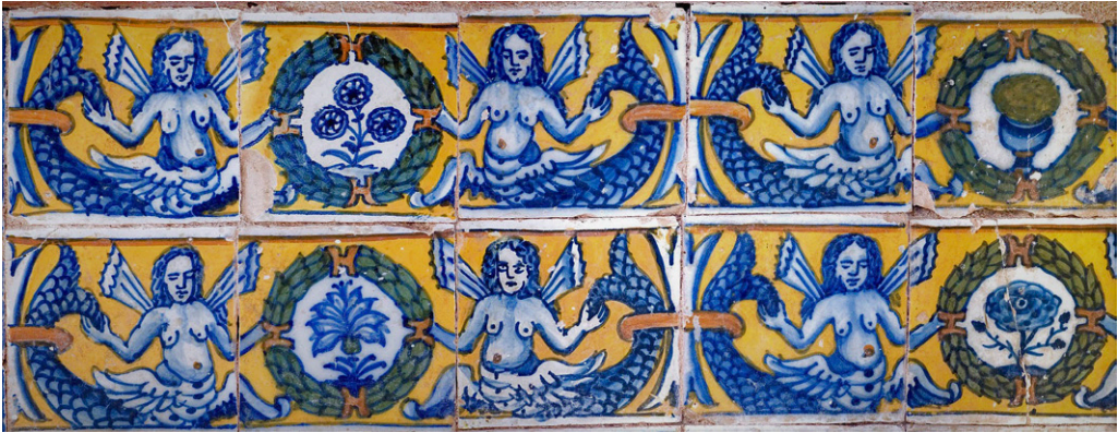
Fig. 3. Cercadura com símbolos marianos. Igreja de Nossa Senhora da Graça do Divor, Évora, c. 1610.

sujeitável a modelos rígidos ou a regras clássicas impostas de fora, a sua contínua capacidade para absorver inúmeras influências, as diversas renovações estilísticas e os motivos mais variados, mas incorporando e recriando todos esses elementos de maneira altamente pessoal, predominando um sentimento decorativista de raiz popular e expressão híbrida, na qual as manifestações erudizantes são normalmente informadas pela concepção prática e a experiência empírica, o que está excelentemente manifestado pelo azulejo, através do papel desenvolvido por pintores, oleiros e ladrilhadores. 14