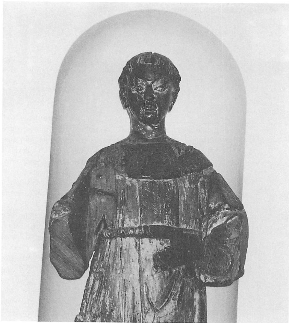
FIGURA 1 – Santo António de Lisboa - Imagem da Capela do Palácio Ceia (Universidade Aberta).

nos domínios físico e espiritual, verifica-se que, influenciado pela Patrística Grega, reabilita a consideração do homem como um microcosmo, logo assumindo uma realidade corpórea e anímica da natureza humana à natureza da criação ... num movimento solidário e concomitante, eis um dos traços mais vincados da espiritualidade antoniana». Parfraseando o Santo, «... é normal que todos os homens, mas sobretudo os filhos deste século, desejem a tranquilidade da paz, a saúde do corpo, a clemência do clima e outras coisas que respeitam ao uso e necessidade desta vida».