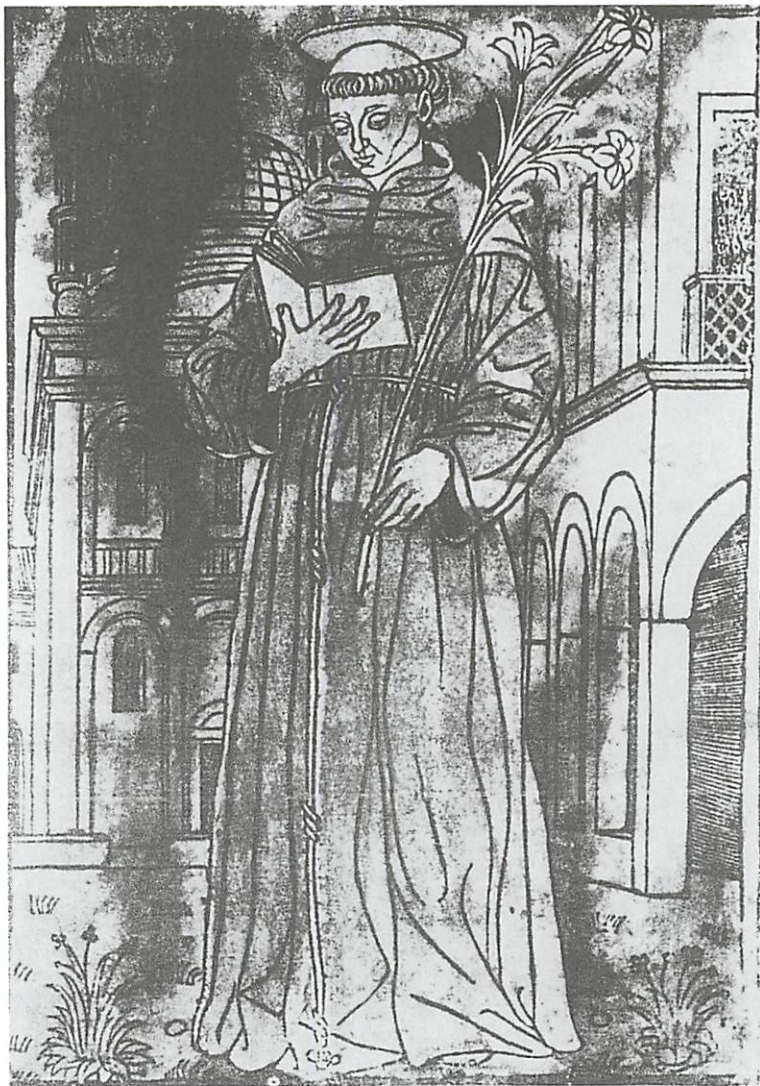
FIGURA 4 - The Illustrated Bartsch , supl. 164, Abaris Books - Artista anónimo de Ravenna do século XVI. Compare-se a face do santo nesta gravura com a fotografia da figura 5.

Assim foi António. O Santo. Varão Fiel, Cristal de Deus, pela transparência cristalina da sua personalidade austera e volátil na diafaneidade de transluzir Deus. «Vejo o meu Senhor» foram as suas últimas palavras em Arcella, partia assim quem ficaria para sempre indiciado como o Cidadão Português, Italiano (Fig. 4), logo e muito actualmente Europeu, Africano no seu sonho Missionário e Universal na sua realização e empenhamento de Cristão Franciscano.