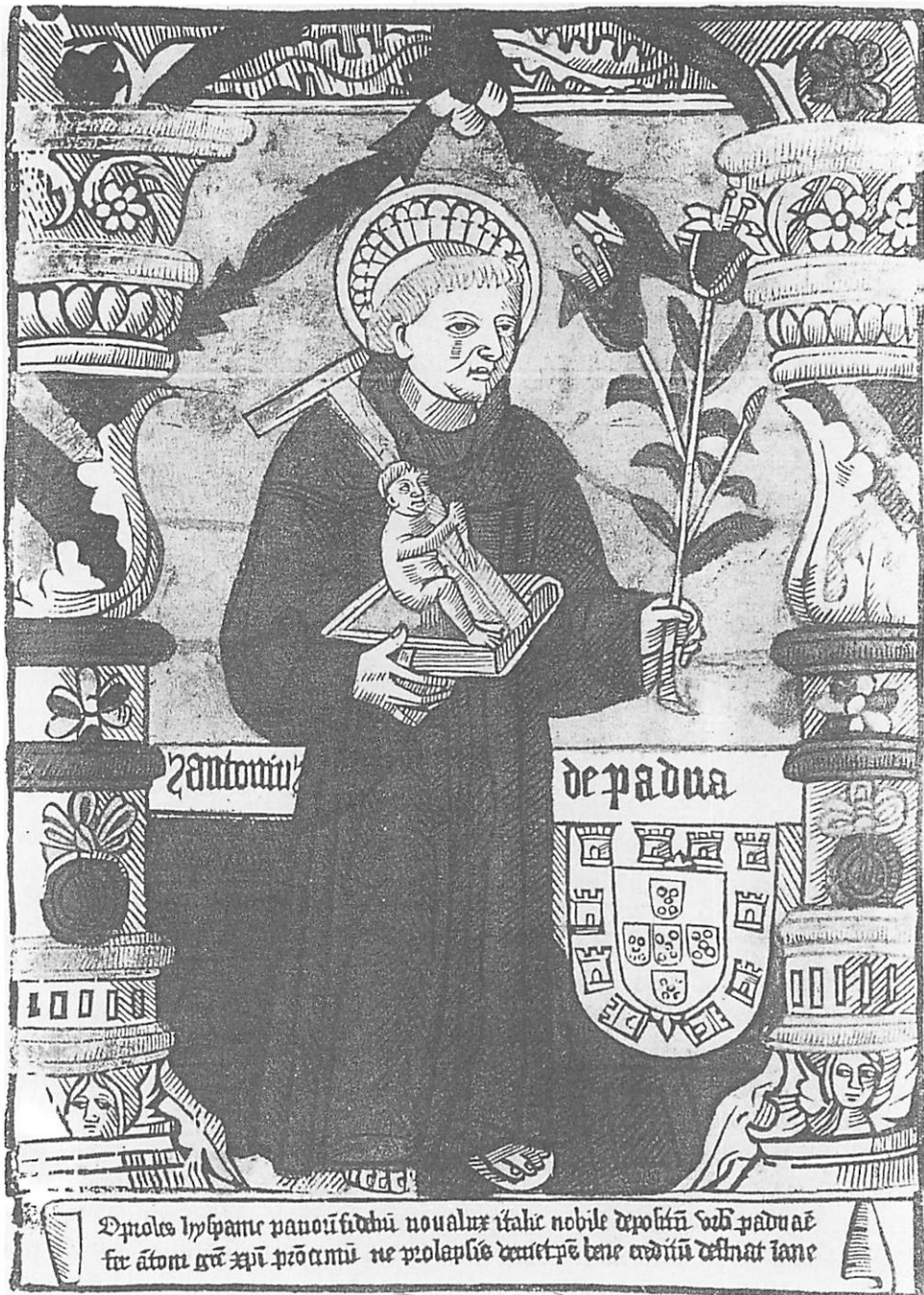
FIGURA 2 – Gravura que mais se aproxima à referência da Bula Apostólica de 1486 retirada de The Illustrated Bartsch , Abaris Books, 1992, USA – Artista anónimo do século XV (?).