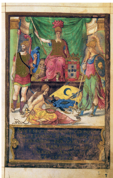
Fig. 4. Sucesso do Segundo Cerco de Diu 47). de Jerónimo Corte-Real.

no espaço extra-europeu, a fortuna acompanha o devir dos monarcas portugueses. D. João III, o sucessor de D. Manuel, é o rei que para celebrar o seu casamento com D. Catarina de Áustria (1525) encomenda, em Bruxelas, um conjunto de tapeçarias que comemoram a união entre as casas ibéricas (Gomes, 2009: 125). Numa delas, os reis portugueses surgem a ladear o globo terrestre, sendo D. João, que aparece com um manto vermelho e apontando o seu ceptro para Lisboa, a capital do seu império, representado como Júpiter e D. Catarina como Juno (Buescu, 2008:182-191). Também Carlos V, na sua entrada em Nápoles a 25 de novembro de 1535, vê o seu poder imperial ser representado como Júpiter, enaltecendo-se uma ideia de império que superava o da Antiguidade Clássica (Kohler, 2001: 260-261). A D. Sebastião, o neto que subirá ao trono por morte de D. João III, depois de seu pai prematuramente ter falecido, é atribuído o cognome de “O Desejado”. Este: “(...) advém do dramático