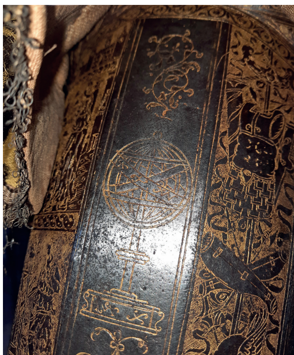
Fig. 3. Esfera armilar no coxote esquerdo, Armadura de D. Manuel. https://imaginariusbellica-remilitari.fcsh.unl.pt/default.aspx?lang=pt