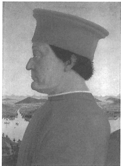
Fig. 2 — Federico da Montefeltro Piero della Francesca, Galeria dos Uffizi — Florença