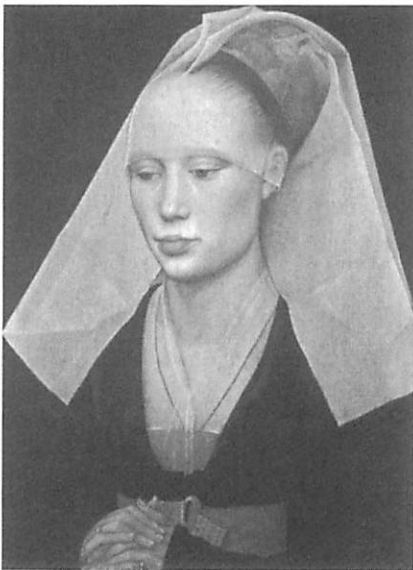
Fig. 1 — Retrato de Senhora Rogier Van der Weyden, National Gallery of Art — Washington

artístico. Tal tarefa deverá ter em consideração o maior número de casos possível para que não se excluam exemplos importantes da vasta retratística existente. Em segundo lugar, é preciso apurar a finalidade exacta de um retrato para determinar a natureza do retratado, que pode ou não ser o encomendante do mesmo, e do artista que executa a obra para um maior entendimento do contexto sócio-cultural envolvente. Em terceiro lugar, ao determinar os fins da arte do retrato verificámos que ela se encontrava ao serviço do Estado como parte interveniente da afirmação e da encenação do seu poder. Por último, na sequência dos matrimónios entre famílias reais, constatámos que o retrato individual ou colectivo permitia à coroa a perpetuação desse vínculo contratual que constituía elo de ligação fundamental para a união ainda que momentânea em alguns casos entre regiões diversificadas. Neste sentido, podemos defender a ideia de que a retratística serve de elemento aglutinador de um vasto território que conheceu os seus primeiros traços de união político-diplomática durante o período do Renascimento através dos seus particularismos e especificidades atrás analisadas. Julgamos assim poder falar da arte do Retrato como uma das faces emblemáticas da construção da Europa.