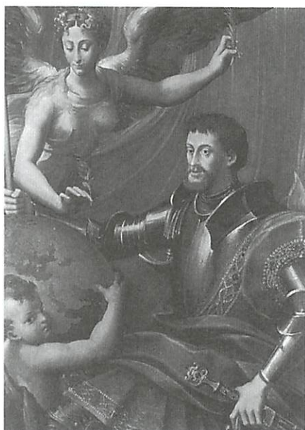
Fig. 4 — Carlos V Parmigianino (atrib.), Col. Rosenberg & Stiebel — Nova Iorque