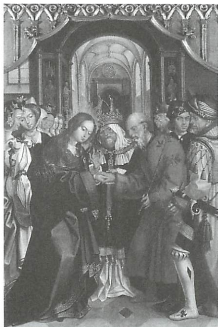
Fig. 6 — Casamento de Maria e José Retábulo do Convento do Paraíso (c.ª 1527), Gregório Lopes, Museu de Arte Antiga de Lisboa