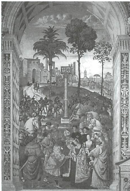
Fig. 5 — Casamento de Filipe III e Leonor de Portugal Biblioteca Piccolomini — (1502-1508) Pinturichio — Siena