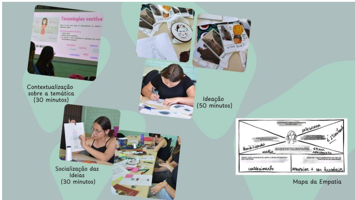
FIGURA 2 - Dispositivo Workshop “Wearable e Gênero”