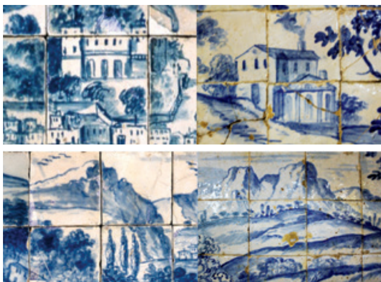
Fig. 6 – À esquerda, pormenores do “Grande panorama”, MNAz. À direita, pormenores azulejos Ig. Santiago (Évora) – 1699

No entanto, a expressividade emprestada às pinceladas de azul, em interessantes aguadas de densidades progressivas, é comum a todas as obras de Barco e está bem patente no Grande Panorama de Lisboa (fig. 6). Além disso, este pintor, que ao tempo explorava experimentalmente as potencialidades dessas aguadas, revela certas dificuldades, algo ingênuas, no lançamento arquitectónico de edifícios e espaços, com notórias deficiências na perspectivização dos mesmos. A excepção