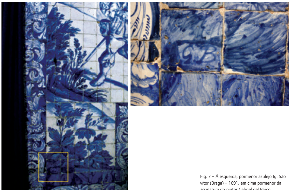
Fig. 7 – À esquerda, pormenor azulejo Ig. São vítor (Braga) – 1691, em cima pormenor da assinatura do pintor Gabriel del Barco

Todavia, estamos em crer que, atendendo às dimensões consideráveis do painel e ao número elevado de encomendas que Gabriel del Barco por esses anos satisfazia para Évora, Arraiolos e outros locais em Lisboa, o Grande Panorama resulta com forte probabilidade de uma obra oficial, isto é, uma peça que contou com a participação de mais do que um pintor na sua execução. Com actividade comprovada (e assinada) que remonta pelo menos ao início da década de 90 na empreitada azulejar da igreja de São Vítor em Braga (fig. 7), entre 1698 e 1699, Gabriel del