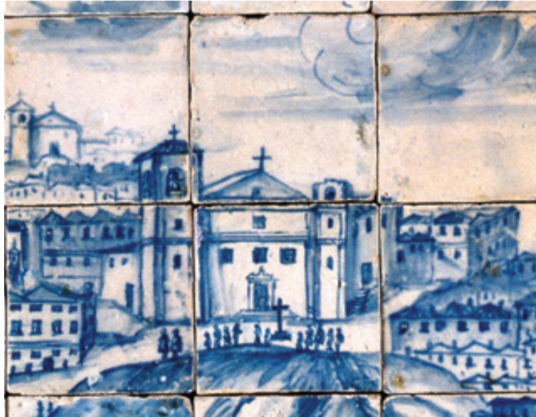
Fig. 3 – Pormenor da Igreja de Santa Catarina com a torre em construção.

todas as quatro faces acabada com simalhas e piramedes ” (Coutinho, Vol. I, 2010, pp. 247-248). Com efeito, se observarmos com atenção a representação da igreja de Santa Catarina de Monte Sinai no Grande Panorama , reparamos que a mesma é desenhada com a referida segunda torre sineira em construção, tal como a documentação do arquivo da igreja confirma para o ano de 1699 (fig. 3).