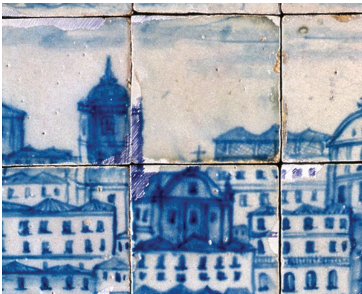
Fig. 4 – Frontispício da Igreja do Loreto e ausência da Igreja da Encarnação.

A omissão da representação da igreja de Nossa Senhora da Encarnação no painel fica certamente a dever-se ao facto de esta ainda não estar construída no local que lhe foi destinado, isto é, fronteira à igreja de Nossa Senhora do Loreto que aparece com a fachada bem desafogada, voltada para o Tejo (fig. 4).