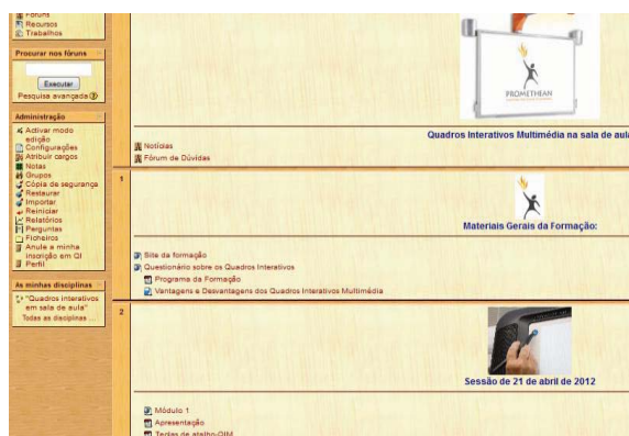
Ilustração 7- Panorama geral da disciplina Moodle que serviu de base à

E apesar da formação ter sido inicialmente pensada apenas para o departamento de Português (grupo 300) acabámos por estendê-la também a professores do 2º, 3º Ciclos do Ensino Básico e do Ensino Secundário do AEA de outros grupos disciplinares. Organizámos a disciplina da formação na plataforma Moodle do CFIAP (Ilustração 2) e o sítio (Ilustração 3) onde disponibilizámos os recursos do QIMTERATIVO de Português. A disciplina Moodle visou acompanhar e auxiliar os formandos ao longo de todas as sessões da formação. Foi criado um tópico para cada uma das sessões, num total de nove, sendo que apenas seis correspondiam aos momentos da formação. Nesses espaços foram disponibilizados os recursos necessários para o desenvolvimento das atividades, bem como as tarefas a realizar. Criámos também um fórum de dúvidas, caso os formandos pretendessem partilhar as suas dificuldades relativamente aos QIM em contexto educativo ou sobre a construção dos recursos para QIM.