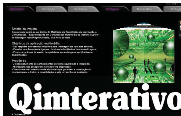
Ilustração 8 - Panorama geral do sítio de apoio à

Optámos por colocar nesta plataforma o endereço do nosso sítio, cuja consulta poderia fornecer informação adicional e recursos de diferentes grupos disciplinares (construídos pelas formadoras) aos formandos.