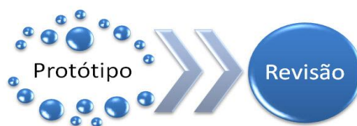
Figura I - Ciclo de desenvolvimento do protótipo (adaptado de Allen, 2001)

Com os avanços tecnológicos surgem novas possibilidades e mais interatividade. “A criação de módulos que possam ser boas experiências interativas implica que se envolvam os estudantes, que se otimize o tempo de aprendizagem, que se atenda às necessidades de cada um individualmente e que se possibilite uma prática que seja significativa” (Lencastre, 2009: 39). Assim, um bom protótipo deve ser o mais simples possível e as competências, que se pretendem que os utilizadores obtenham no final, devem englobar quatro componentes: contexto, tarefas, atividade e feedback.