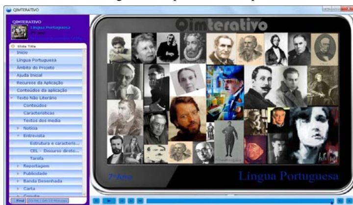
Figura II- Aspeto do Protótipo

Para o seu desenho compilámos os conteúdos que seriam abordados em cada um dos tópicos da disciplina e efetuámos o esboço dos itens que iriam ser abordados. Definimos, também, a organização da informação, tendo optado por uma navegação através de um menu lateral e através de botões de navegação. Relativamente ao menu lateral em cascata, este contemplaria apenas entradas de nível I e de nível II; as entradas de nível III poderiam ser acedidas clicando nas entradas de nível II e navegando através de botões de avanço e de retrocesso. Para além destes aspetos, centramo-nos na facilidade em usar e em aprender a usar, para a qual contribuem a compreensão da estrutura, a navegação e orientação, o aspeto gráfico e a consistência da interface.