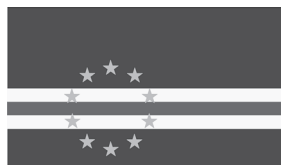
Vlag van Kaapverdië