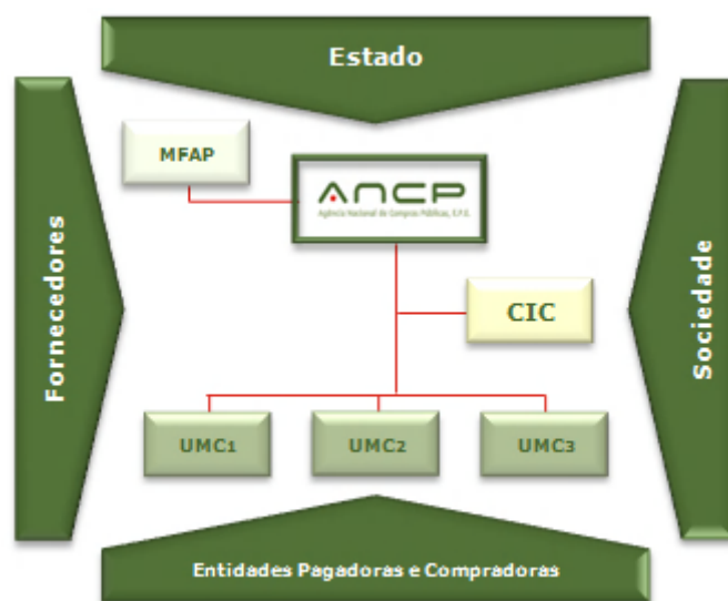
Figura retirada de WWW.ancp.gov.pt

O SNCP é um modelo organizativo que, mediante a gestão da ANCP, pretende tornar mais eficazes e eficientes as compras do Estado. No modelo definido o SNCP integra a ANCP, as UMCs e as entidades compradoras dispersas pelos diversos organismos da Administração Pública, que podem ser entidades vinculadas e entidades voluntárias. (cf DL 37/2007)