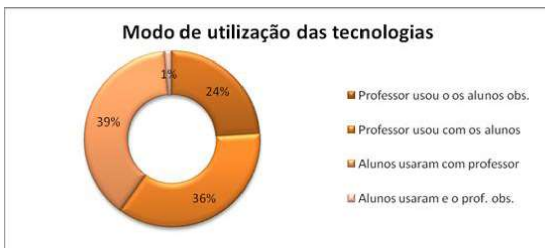
Figura 3: Modo de utilização das tecnologias nas disciplinas de ciências.

O recurso a tecnologia, por parte dos professores, deu-se com diversos objetivos sendo que foi utilizada, sobretudo, no desenvolvimento de conteúdos (essencialmente nas aulas de matemática) e para pesquisar informação. Também foi utilizada na elaboração de relatórios (essencialmente nas aulas de química e física e química) e, pela análise da figura 4 constata-se que alguns professores também recorreram às tecnologias para relacionar os conteúdos lecionados com o quotidiano e recolher dados experimentais.