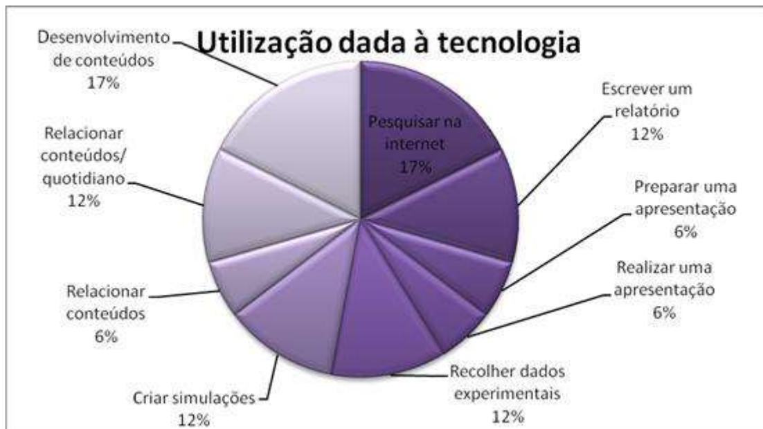
Figura 4: Utilização dada às ferramentas tecnológicas.

Também os dados recolhidos nos questionários aplicados aos alunos na terceira fase de recolha de dados reportam para uma utilização das tecnologias sobretudo para o desenvolvimento de tarefas mais práticas, como a resolução de problemas, realização de exercícios e elaboração de trabalhos práticos, como apresentado na figura 5.