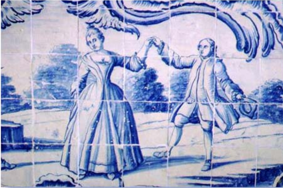
Figura 4 – Cena de Dança, painel da 2. a metade do século XVIII. Palácio Ceia, Lisboa

Elemento fundamental do cortejar materializou-se com o modo de viver o corpo socialmente e como instrumento de representação da sociedade.