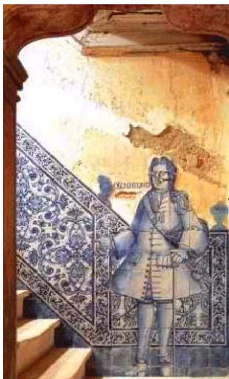
Figura 2 — Escadaria da antiga casa nobre, Figura de Convite (1730-1750), Rua de São Boaventura, Bairro Alto, Lisboa

Torna-se óbvio que esta questão se relacione com a decoração da própria habitação, onde se revela a distinção e o status do proprietário da casa e onde a azulejaria barroca conheceu uma função social muito bem demarcada. As conhecidas figuras de convite – nas diferentes atitudes de receber o visitante – foram talvez a tradução visual mais fiel de um discurso de entrada e de aparato. Revestindo uma zona social da casa: escadas, varandas, terraços, átrios e portas de acesso, acompanharam a separação entre o quotidiano e o mundano.