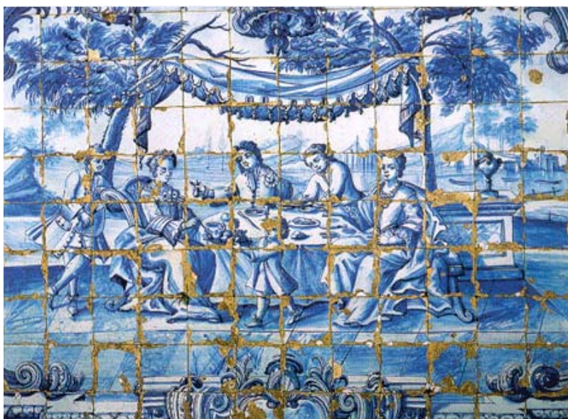
Figura 3 — Cena de refeição, painel de meados do século XVIII, Quinta de Manique, Estoril

A encenação deste quotidiano privado foi trabalhado pela iconografia azulejar de forma mais ou menos ingénuo. O tema da refeição tanto interior como exterior é recorrente. (Fig.3)