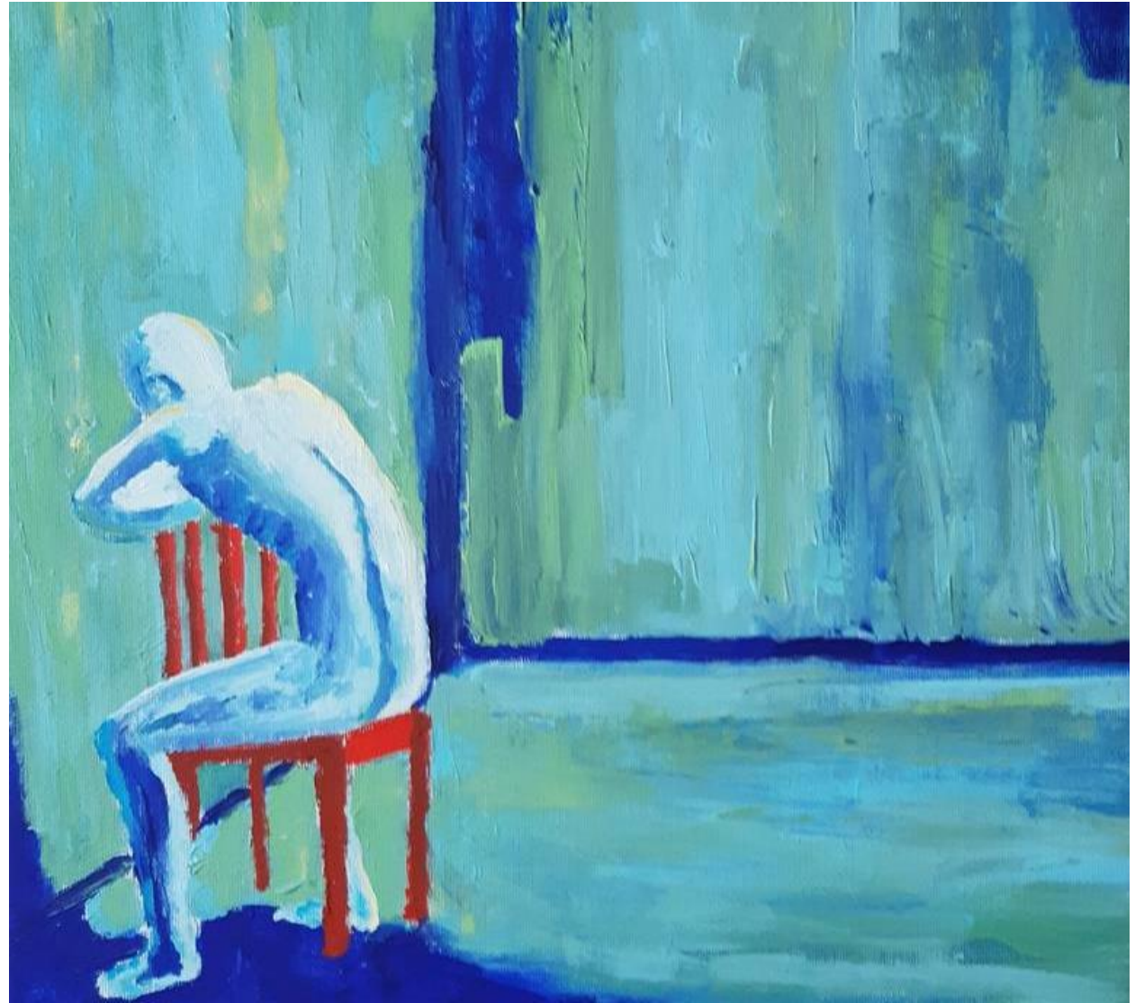
“Excluded” by Mats Eriksson, 2019