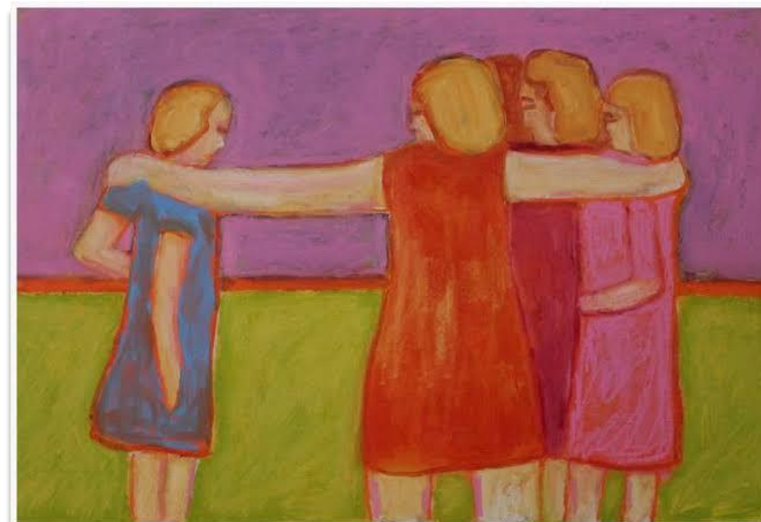
Inclusion by Shirray Langley