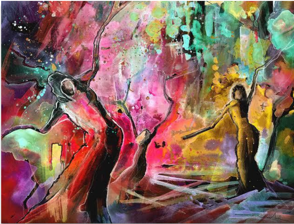
OUTCAST BY MIKKI DA GOODABOOM