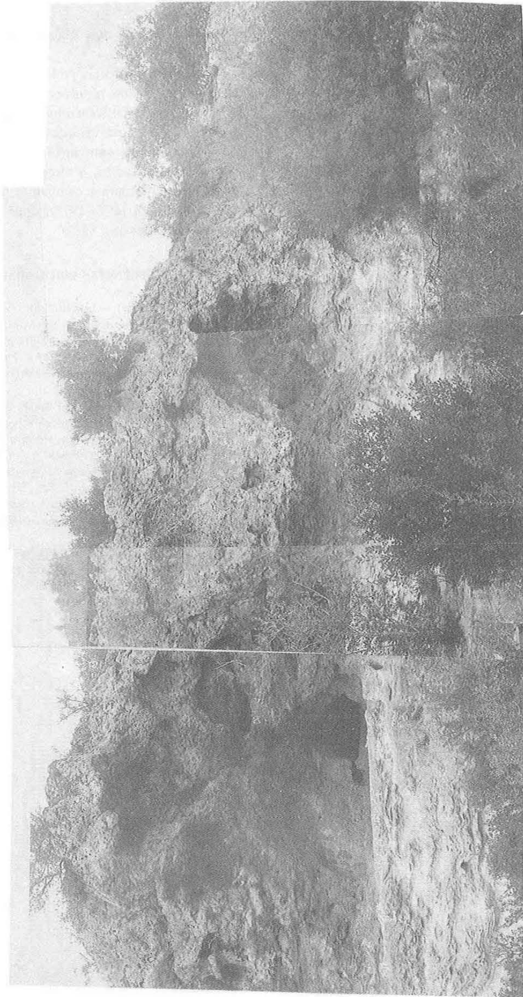
Fig. 2 — Vista parcial da escarpa onde se situa a gruta, cuja entrada é visível do lado esquerdo.