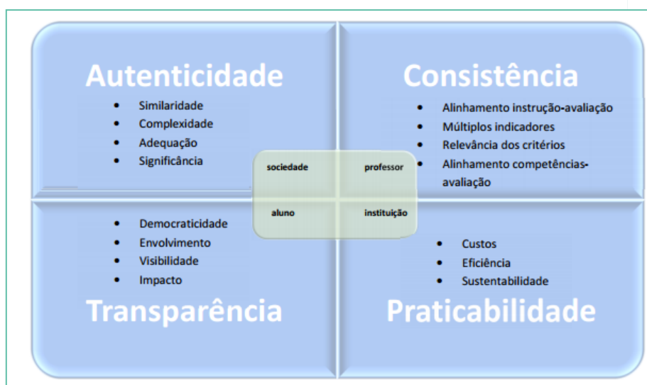
Figura 2 - Dimensões da Avaliação Alternativa Digital

Dessa forma, o professor ao elaborar avaliações digitais alternativas utilizando como referência as dimensões e os critérios do modelo PrACT pode avançar para um paradigma edumétrico. Esse modelo pode ser melhor visualizado na figura a seguir, em que há o destaque para a inter-relação das dimensões ao se enfatizar em cada uma delas os principais atores envolvidos: a instituição, o professor, o aluno e a sociedade.