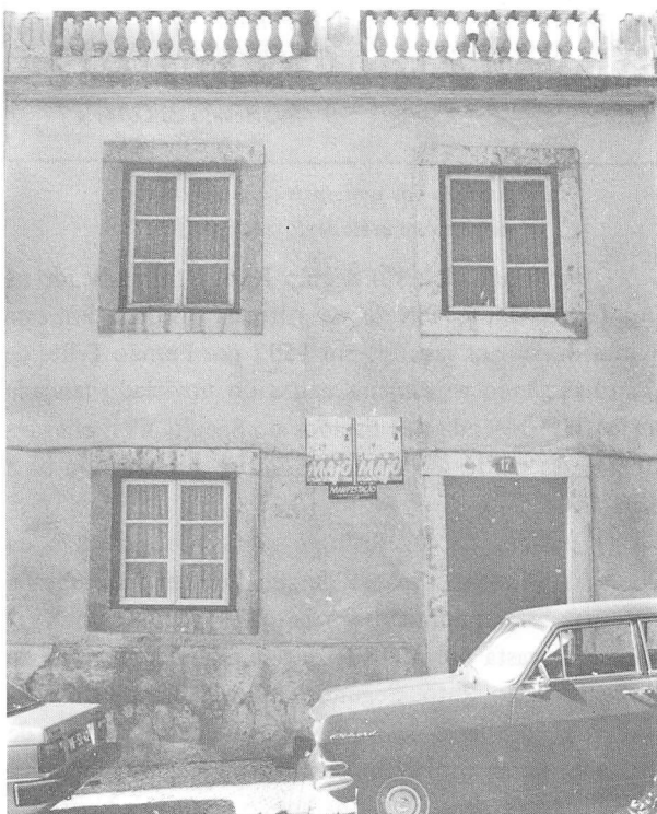
Habitação operária edificada em 1749