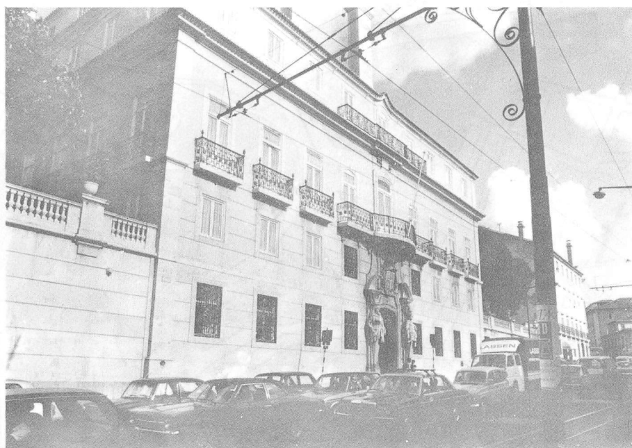
Palácio Palmela (último quartel do Século XVIII)

segundo Gustavo de Matos Sequeira (8) , foi edificado no último quartel do Século XVIII. Residência dos Marqueses de Viana no Século XIX, foi adquirido, mais tarde, pelo Marquês da Praia e Monforte. Outra obra arquitectónica desta época é o chafariz do Rato, da autoria de Carlos Mardel. Construção de carácter utilitário, de grande importância para a população da zona, testemunha também a beleza ornamental que caracteriza as produções do género.