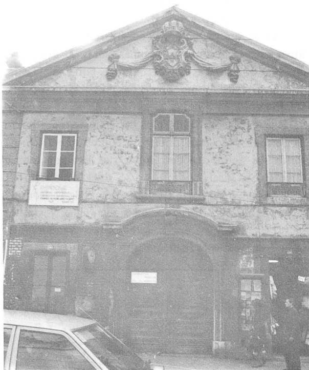
Fachada da Fábrica das Sedas (1734 - 1741)