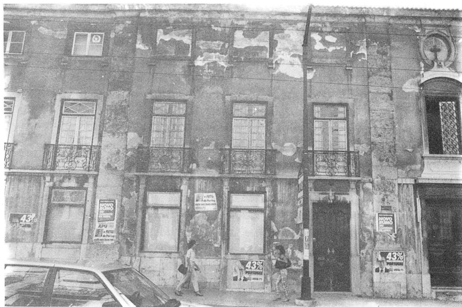
Palácio Alagoa (1759 - 1762)

Já no Rato ergue-se outro grande palácio o qual,