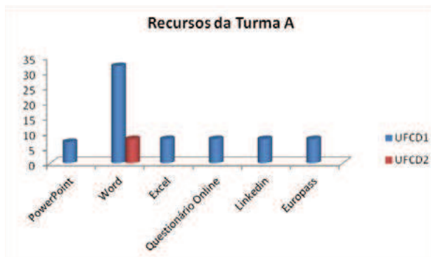
Figura 3 – Recursos utilizados pela Turma A

Importa ainda um olhar atento sobre o seu desempenho na primeira UFCD lecionada, dado ser o primeiro contacto com o modelo de ensino (Figura 4).