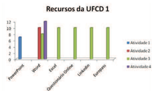
Figura 4 – Recursos utilizados na UFCD 1 – Turma A

Como primeira atividade sugerimos um trabalho a pares de elaboração de uma apresentação eletrónica sobre uma temática já discutida e a partir de documentos facultados. Constatámos um nível de iliteracia digital, por vezes muito acentuado, em alguns formandos. A par de um desconhecimento tecnológico na elaboração de uma apresentação eletrónica, estes alunos também revelaram desconhecimento no que se refere à pesquisa na Rede. A nível contextual também a elaboração de um texto argumentativo e reflexivo se configurava como problemático. Pretendia-se ainda que o resultado desta primeira atividade fosse apresentado oralmente ao restante grupo, prática que evidenciámos ser desconhecida para a maioria dos formandos. Mais uma vez a avaliação formativa revelou-se imprescindível porquanto a orientação, regulação e feedback dados a cada formando individualmente propiciaram uma confiança e capacitação das valências argumentativas e até de postura face a um público.