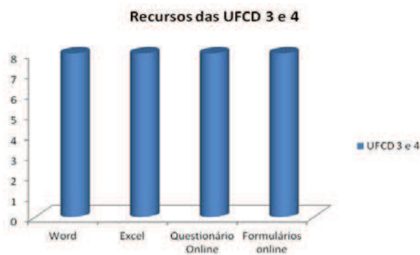
Figura 7 – Recursos da UFCD 3 e 4 – Turma B

um plano de marketing se tratava, optámos por abordar simultaneamente a teoria e a prática. Este foi o maior desafio para estes formandos, tanto a nível tecnológico como de conteúdos. Foi lançado o repto para elaboração de um questionário online, partilha do mesmo, aplicação aos restantes alunos da escola e posterior análise e tratamento em excel, tendo como corolário um relatório em word. Se a nível tecnológico não foram significativas as dificuldades, a avaliação formativa revelou-se muito pertinente a nível contextual, nomeadamente no que concerne à elaboração, aplicação e análise e tratamento dos dados do questionário.