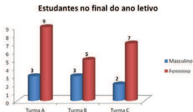
Figura 2 – Estudantes no final do ano letivo

Porém, e por razões várias, entre as quais situações de desemprego, serviço militar, desinteresse, consciencialização da dificuldade de conciliação de horários e esforço suplementar na harmonização da vida pessoal, profissional e escolar, alguns destes alunos não concluíram a área tecnológica agora em análise. Assim, no final do ano letivo (Figura 2), registávamos 12 estudantes na Turma A, 8 estudantes na Turma B e 9 na Turma C.