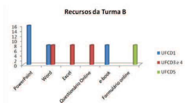
Figura 5 – Recursos utilizados pela Turma B

Analisemos agora o comportamento dos estudantes da Turma B, a meio do seu percurso e tendo, no ano anterior, trabalhado já com a plataforma Moodle. Estávamos assim expectantes quanto a esta turma no que concerne ao grau de conhecimento e destreza a nível tecnológico e era nossa intenção tentar perceber qual o conhecimento e receptividade face ao ambiente 2.0. Antes de um olhar particular sobre o seu comportamento constatemos os recursos utilizados por estes estudantes, ao longo do ano letivo (Figura 5).