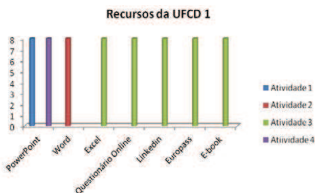
Figura 6 – Recursos da UFCD 1 – Turma B

A primeira UFCD lecionada foi coincidente com a da Turma A pelo que importa uma análise comparativa. Ainda que o nosso repto tivesse sido o mesmo para as duas turmas constatámos, nesta Turma B, outras opções a nível de recursos utilizados (Figura 6).