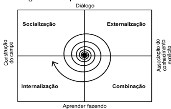
Figura 1– Espiral do conhecimento.

De acordo com Nonaka e Takeuchi (1997, p. 62), a construção do conhecimento consiste numa espiral que: “[...] surge quando a interação entre conhecimento tácito e conhecimento explícito eleva-se dinamicamente de um nível ontológico inferior até níveis mais altos”. Esta construção está relacionada a quatro quadrantes de conversão do conhecimento, como mostra a Figura 1.