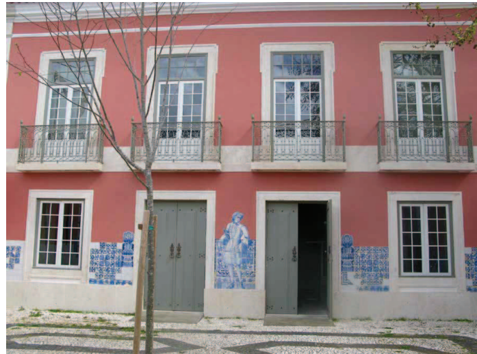
Fig.3– Fachada lateral sobre o jardim