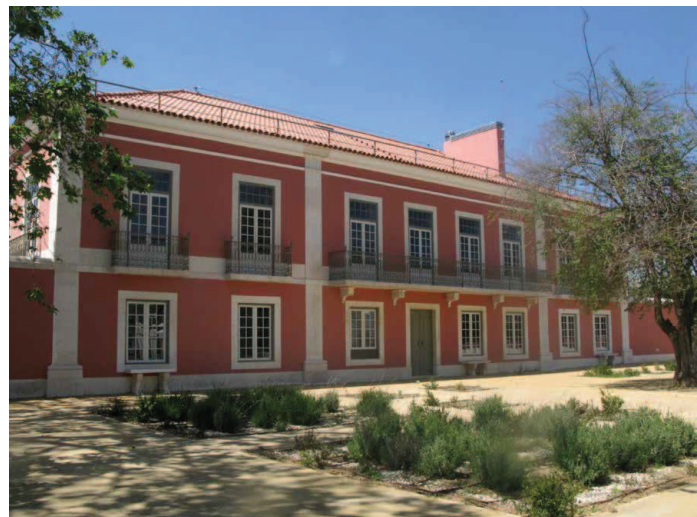
Fig.4 - Pátio de honra e fachada principal