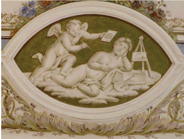
Fig.5 - Pormenor da pintura mural alusiva às Artes