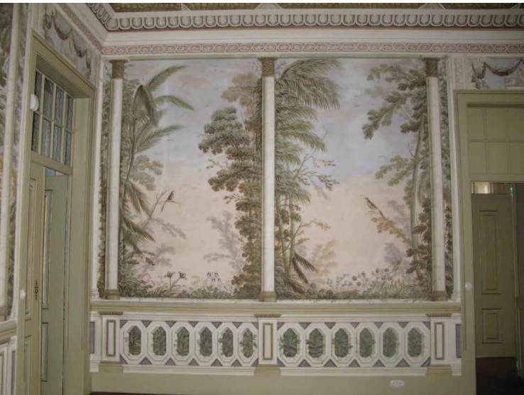
Fig.6 - Pormenor da pintura mural. Sala de aparato. Antiga sala de jantar