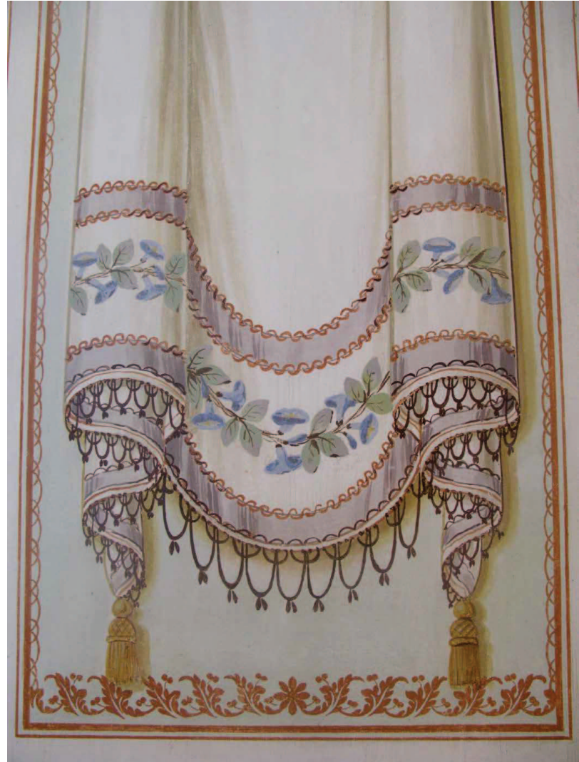
Fig.7 - Pormenor da pintura mural. A designada Sala dos Panos