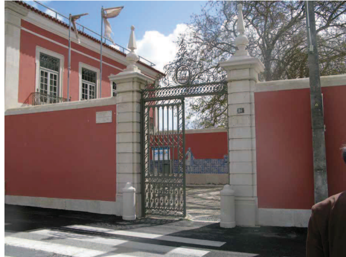
Fig.2 – Quinta Alegre: entrada principal