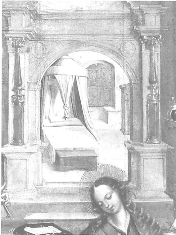
Fig. 9 — Gregório Lopes — Anunciação. Retábulo do Mosteiro de Santos-o-Novo. Museu Nacional de Arte Antiga (c. 1540)

Analisemos também alguns exemplos de fundos arquitectónicos de exterior. No painel que representa a Degolação de São João Baptista , do retábulo da Igreja de São João Baptista em Tomar, de autoria de Gregório Lopes, nota-se uma influência inegável da arte do tempo. Repare-se, por exemplo, no pormenor das estátuas que se sentam no cimo desse edifício e as situadas no topo da Igreja do Convento da Graça em Évora e que lhe confere plena actualidade e modernidade estéticas. No painel do Julgamento