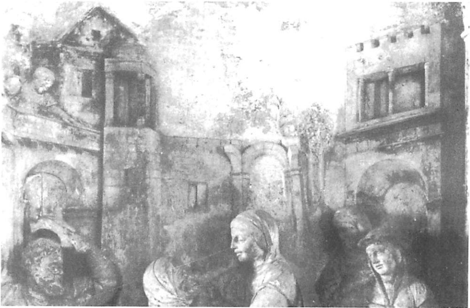
Fig. 8 — João de Ruão — Visitação. Retábulo da Igreja da Misericórdia de Coimbra (1547)

Analisemos agora a presença de arquitecturas fantásticas e, em certa medida, utópicas nos fundos de retábulos escultóricos. Este tipo específico de cenografia encontra-se variadas vezes na obra pictórica do tempo e, como vimos, rareia na escultura retabular. Todavia, as edificações presentes na Lamentação de Cristo Morto em São Marcos de Tentúgal e a espacialidade arquitectónica criada na Adoração dos Pastores na Pena em Sintra de autoria de Chanterene, e o aglomerado urbano de fachadas e edifícios da Visitação da Misericórdia de Coimbra de Ruão (fig. 8) são exemplos que demonstram a mesma atitude estética e o mesmo arrojo estilístico que os melhores