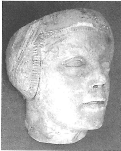
Fig. 1 — Nicolau Chanterene? Cabeça feminina de uma escultura ou de um tondo Mosteiro de Santa Clara-a-Velha de Coimbra — c. 1520

Antes de iniciar a grande empreitada retabular da Igreja do Mosteiro Jerónimo de Nossa Senhora da Pena em Sintra, obra que executou entre 1528 e 1534 aproximadamente, Chanterene desloca-se a Espanha, em particular às pedreiras de Gelsa (perto de Saragoça) para adquirir a quantidade de alabastro necessário para a execução de tão importante empresa, patrocinada pelos Rei D. João III e sua mulher D. Catarina 7 . Esta presença em terras aragonesas (cerca de seis meses) tornar-se-ia decisiva para a formação estética do escultor já que o contacto (re)estabelecido com os artistas mais destacados que operavam nessa região, como Damián Forment, Filipe Vigarny, Gabriel Joly e Juan de Moreto permitiu considerável evolução no modo de imaginar e conceber a escultura renascentista.