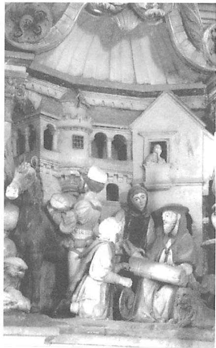
Fig. 4 — Nicolau Chanterene São Jerónimo e os Mercadores Mosteiro de São Marcos em Tentúgal (c. 1522)