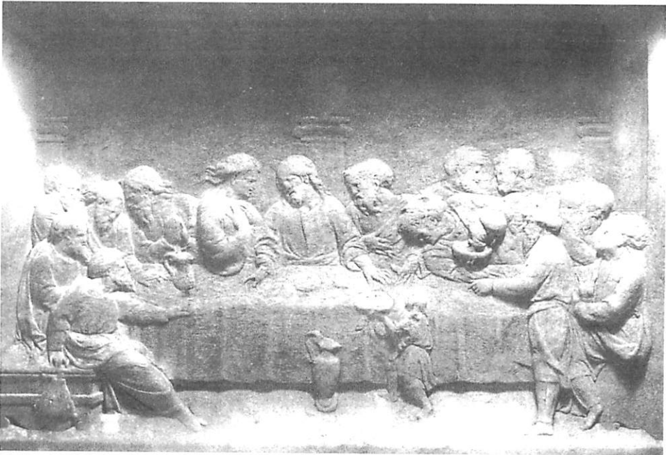
Fig. 6 — Nicolau Chanterene — Última Ceia Retábulo de Nossa Senhora da Pena Palácio Nacional da Pena — Sintra (1528-1534)