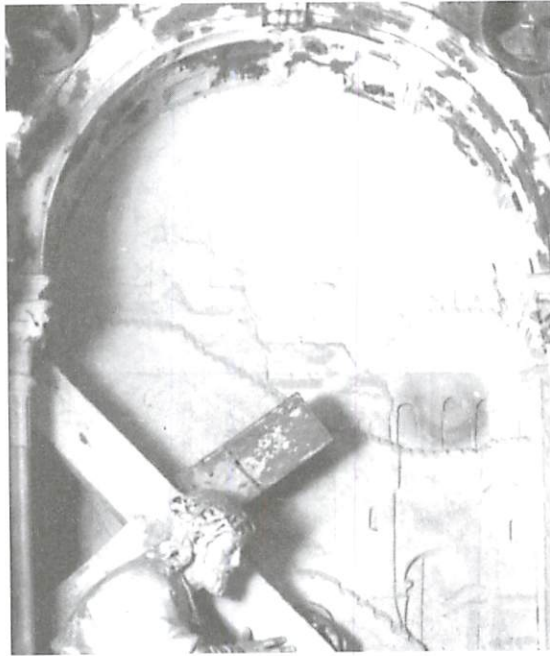
Fig. 5 — Nicolau Chanterene — Quo Vadis? Retábulo de São Pedro na Sé Velha de Coimbra (c. 1526)

Todavia, nem sempre os fundos de arquitectura imaginados procuraram retratar edifícios ou aglomerados urbanos reais. A inventio do artista possibilitava também a idealização metafórica dos arquétipos all' antico na