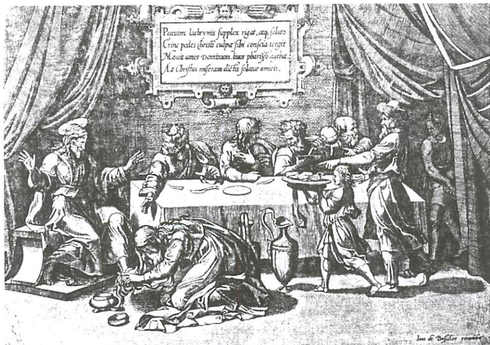
Fig. 7 — Cristo à mesa de Simão o Fariseu — Gravura de Marcoantonio Raimondi

25 Como dissemos anteriormente, a obra de João de Ruão patenteia não só uma grande preocupação em destacar a figura humana, mas também um maior gosto pela adopção de fundos de paisagem. Tal facto mereceria um trabalho a eles dedicado. Quando solicitado a envolver o episódio num contexto arquitectónico, Ruão idealiza simbolicamente as fachadas, os edifícios e as cidades como se de modelos se tratasse. Veja-se, por exemplo, a idealização de uma construção palaciana ao gosto do Renascimento francês presente no São Martinho partilhando a capa no retábulo do Mosteiro de Celas em Coimbra (c. 1542). Situações análogas ocorrem quando representa edifícios de cariz italianizante, nomeadamente nos retábulos de São Miguel de Santa Clara-a-Velha, da Capela do Sacramento e o da Sé da Guarda.