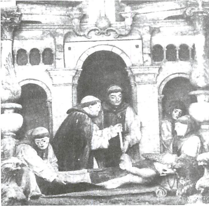
Fig. 2 — Nicolau Chanterene — Morte de São Jerónimo Mosteiro de São Marcos em Tentúgal (c. 1522)

este propósito alguns exemplos. Na Morte de São Jerónimo do Retábulo do Mosteiro de São Marcos em Tentúgal (fig. 2), Chanterene representa uma larga varanda com um grande arco de volta perfeita ao centro que nos faz recordar as varandas do antigo Paço da Ribeira em Lisboa, também elas com esta aparência, a julgar pela iconografia que chegou até nós 20 .