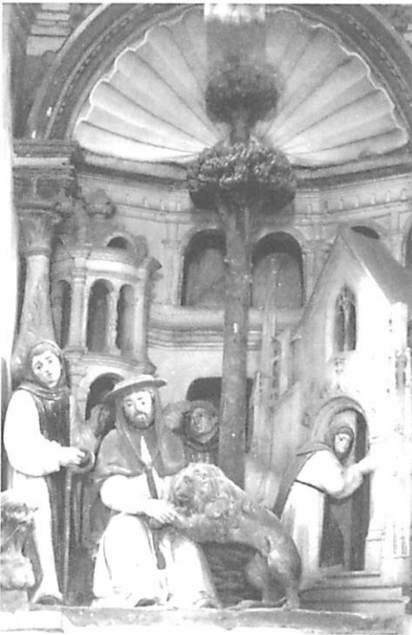
Fig. 3 — Nicolau Chanterene São Jerónimo tirando o espinho do Leão Mosteiro de São Marcos em Tentúgal (c. 1522)

Neste retábulo hieronimita, Mestre Nicolau utilizou outras citações (e não exactas reproduções) do Claustro do Mosteiro de Santa Maria de Belém no cenário do São Jerónimo tirando o espinho do Leão (fig. 3), e de alguns castelos franceses da região do Loire, ainda não identificados, no episódio São Jerónimo e os Mercadores (fig. 4) 21 . As restantes construções arquitectónicas, presentes por detrás das figuras no retábulo de São Marcos evocam claramente a arquitectura do tempo e, muitas delas, ao estilo do primeiro Renascimento francês. De salientar que, ao contrário do que sucede nos relevos de Santa Cruz de Coimbra, Chanterene, ao compor as cenas, não