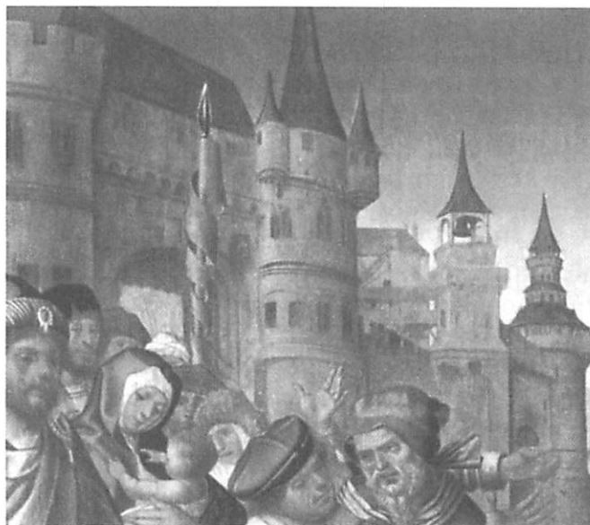
Fig. 10 — Cristóvão de Figueiredo (?) Martírio de Santo Hipólito Museu Nacional de Arte Antiga

O que importa reter dos vários exemplos enunciados é que a arte saída dos cinzéis de Chanterene e Ruão tornou-se capaz não só de enriquecer