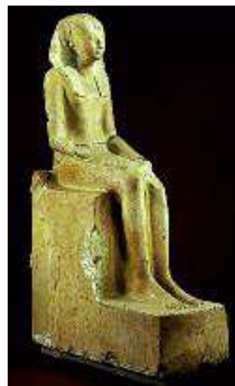
Fig. 1 Estátua de calcário de Hatchepsut, com 1,95 m, proveniente do templo funerário de Deir el-Bahari.

Devido à sua competência técnica, Senenmut ficaria associado à construção, a partir do 8º ano de reinado da faraó, do «templo dos milhões de anos» de Hatchepsut, em Deir el-Bahari, dedicado a Amon, construído em calcário e desenvolvido em três terraços precedidos por colunatas, significativamente conhecido como djeser djsesu , «o sublime dos sublimes», e ao transporte e levantamento do par de obeliscos de granito rosa de Assuão da rainha-faraó no templo de Karnak. Os outros dois obeliscos de Hatchepsut, em Karnak, dos quais um, com 29,56 metros de altura, ainda está pé, foram erguidos por Amenhotep.