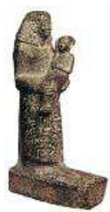
Fig. 2 Estátua do arquitecto e director de trabalhos de Hatchepsut como preceptor da princesa Neferuré, filha de Hatchepsut e de Tutmés II. Museu Egípcio do Cairo.

É claro que Hatchepsut só pôde alcançar o desiderato real porque beneficiou do decisivo apoio destes importantes dignitários, alguns