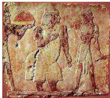
Fig. 3 Baixo-relevo do templo funerário de Hatchepsut em Deir el-Bahari, mostrando a rainha de Punt, Eti, e o seu marido Perehu.

deles, como se percebe pelos seus títulos, membros do alto clero de Amon, uma verdadeira potência económica, administrativa e ideológica na sua época. Como dizia Sir Alan Gardiner: « It is not to be imagined (...) that even a woman of the most virile character could have attained such a pinnacle of power without masculine support ».