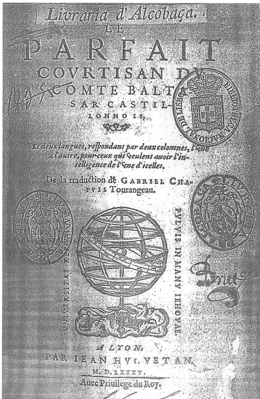
Fig. 2 — Frontispício da obra de Baltassar Castiglione — Le Parfait Courtisan, (trad. Francesa, Livraria de Alcobaça, MDCCXXXIV)