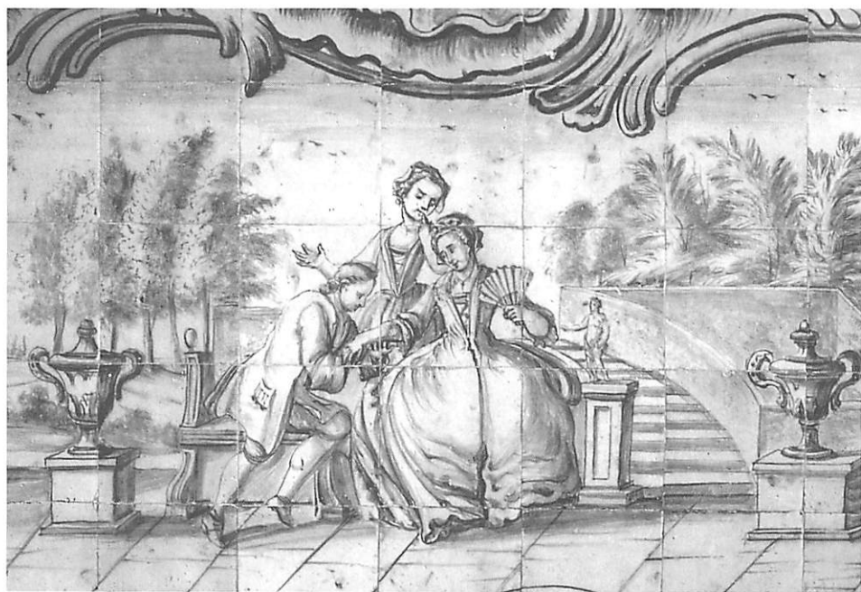
Fig. 4 — Palácio Ceia, Lisboa, pormenor de painel, oficina de Lisboa, 2.º metade do século XVIII